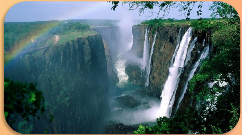
Водопад Виктория - один из крупнейших в мире водопадов (высота 120 м, ширина 1800 м). Назван в честь королевы Великобритании.