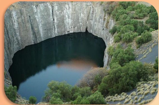
В Южной Африке, на территории ЮАР, расположено самое глубокое отверстие в земле.