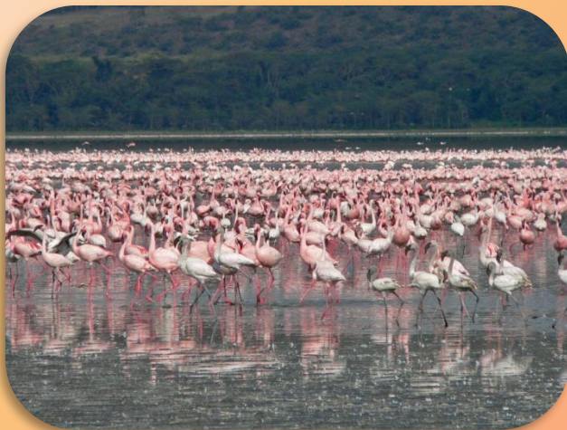
Накуру — подлинная жемчужина национального парка в Кении, один из великолепных уголков мира, где еще осталась дикая природа и миллионы фламинго.