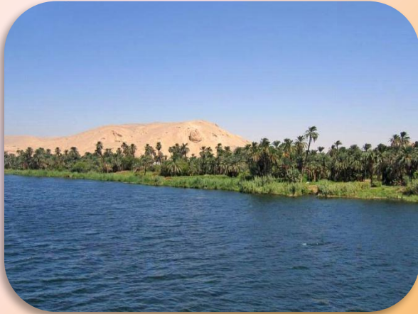
Река Нил - одна из двух величайших по протяжённости рек в мире.