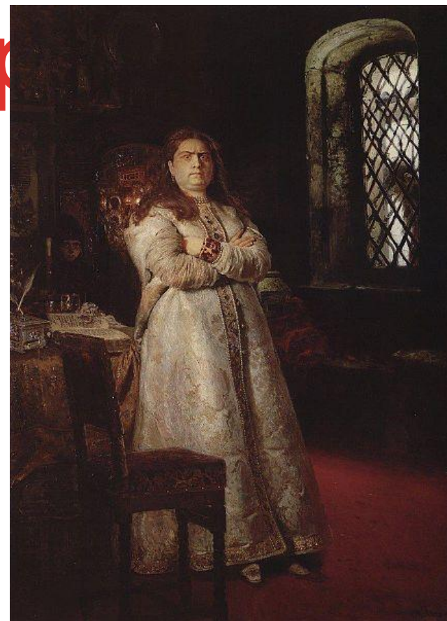
Царевна Софья. Художник: И.Е. Репин

В конце сентября Софья уже была в монастыре. Ей позволили держать возле себя кормилицу, двух казначей и постельниц. Из дворца ей отпускалось определенное количество всевозможных кушаний. Царицам и царевнам было позволено навещать Софью. Караулили ее солдаты Семеновского и Преображенского полка. Позднее она по приказу Петра была пострижена под именем Сусанны. В Новодевичьем монастыре она провела около 16 лет и скончалась в июле 1705 года.