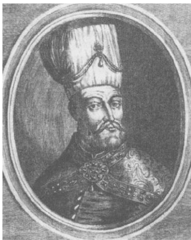
Хованский (его стрельцы называли «батюшкой»)

По просьбе Хованского, действовавшего в пользу Софии, стрельцы принесли царевне челобитную, не только от них самих, но и от многих чинов Москвы, в которой говорилось о малых годах обоих царей, и что правление государством должно быть вручено царевне Софье Алексеевне. Бояре, еще помнящие прошедший бунт, передали правление Софьи по малолетству государей.