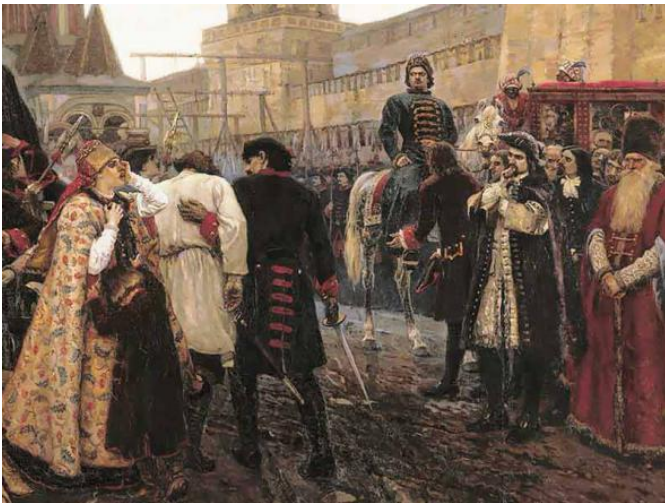
Утро стрельцкой казни

Софье было трудно оспорить законность царствования Петра. Она понимала, что изменить волю царя можно только с помощью бунта. Она решила использовать против Нарышкиных стрельцкие полки. Волнения в них начались еще при правлении Федора. Стрельцы были недовольны своими полковниками, которые заставляли их работать на себя, покупать нарядную одежду на свое жалование. К тому же царевна обещала отменить те перемены, которые сделал Никон в церковных книгах. Для пущей уверенности, им было сказано, что именно Нарышкины погубили весь род царский, и по приказанию Натальи был отравлен царь Федор.