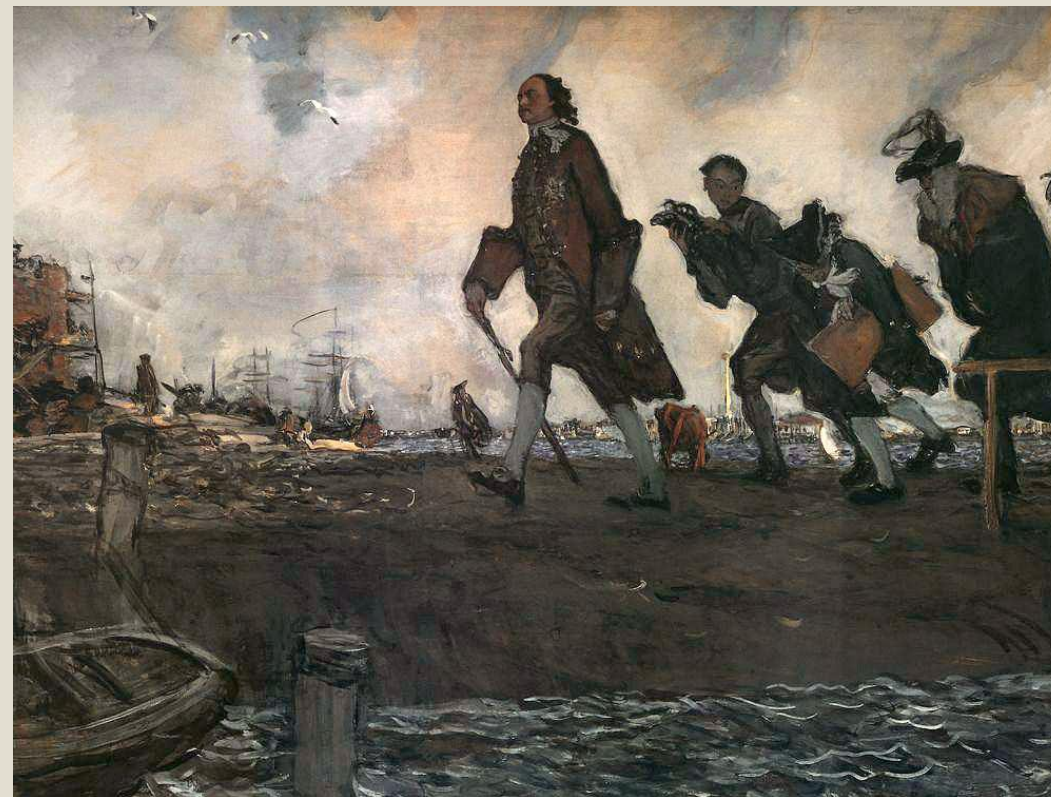
Серов «Петр I на строительстве Петербурга»