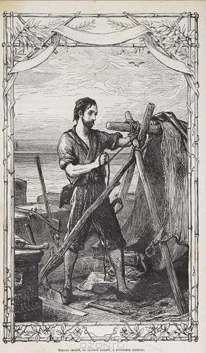
Поруха скалов, на золотой волне, я оставил шалаш.

Вдали от цивилизации Крузо сталкивается с такими проблемами как : муки голода и холода , страх перед дикими зверями. Вскоре он привыкает к такой жизни и начинает заниматься животноводством , строительством и многим другим ... Многие проблемы поджидали его в будущем , но когда ты наедине с самой природой , без помощи , глядеть в будущее - большая роскошь .