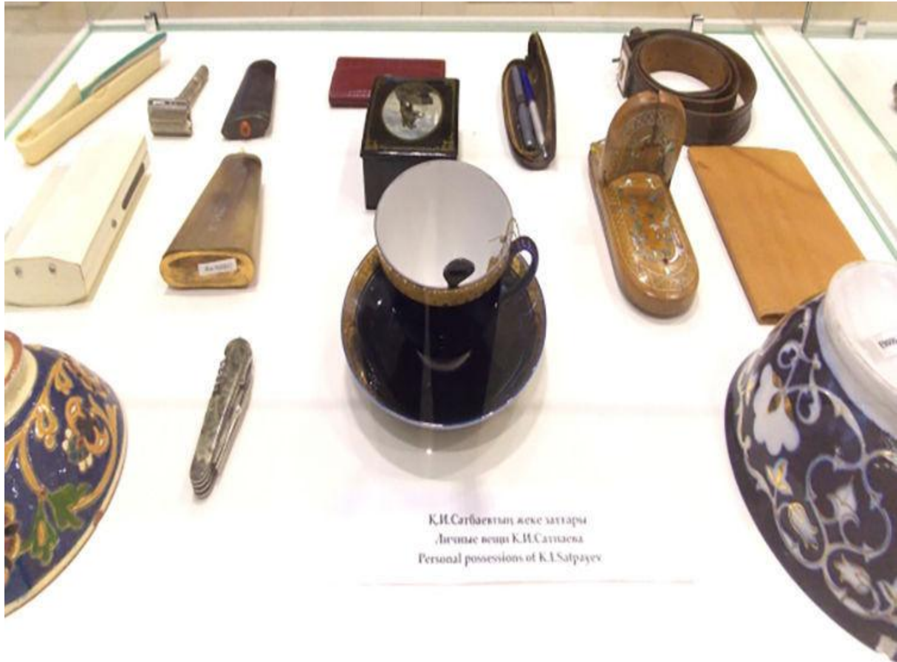
К.И.Сатбаевтың жеке заттары Личные вещи К.И.Сатбаева Personal possessions of K.I.Satpayev