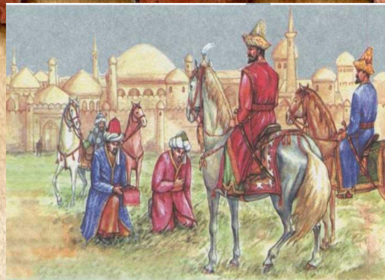
Встреча Касым-хана знатью Ташкента. Художник Т.Асыков