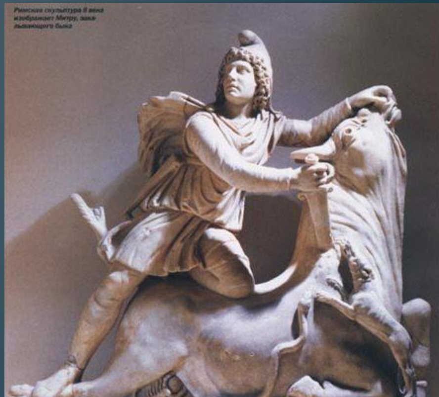
Римская скульптура II века изображает Митру, закалывающего быка