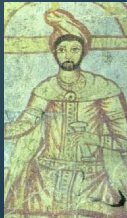
Заратустра. Изображение, найденное в Сирии (ок. III века н. э.)