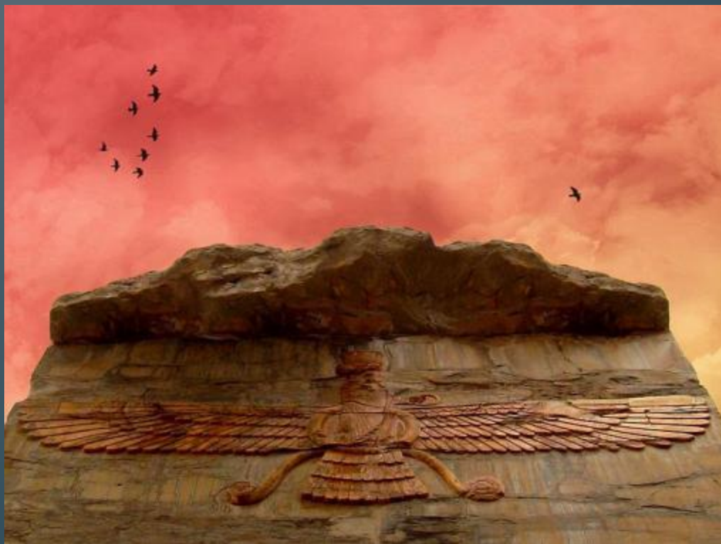
Фаравахар, один из главных символов зороастризма (Персеполь, Иран)

Зороастризм (авест. vahvī- daēnā- māzdayasna- — «Благая вера почитания Мудрого», перс. «بهدين» — behdin, «Благая Вера») — одна из древнейших религий, берущая начало в откровении пророка Спитамы Заратуштры (перс. زرتشت, «Зартошт»; древнегреческая — Ζωροάστρης, «Зороастрэс»), полученном им от Бога — Ахура Мазды. В основе учения Заратуштры — свободный нравственный выбор человеком благих мыслей, благих слов и благих деяний.