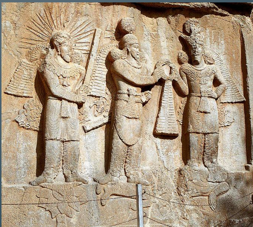
Рельеф с изображением Митры, сасанидского царя Шапура II и Ахура-Мазды