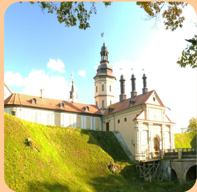
Перший оперно-балетний театр в Несвіжі

Музичне мистецтво Великого князівства Литовського розвивалося в рамках як народної, так і високої культури. Спочатку найбільший вплив мала церковна музика, в XVII столітті почався активний розвиток світського музичного мистецтва, що вилилося у створення приватних оркестрів та капел. Перший оперно-балетний театр європейського класу з'явився в Несвіжі в 1724 році. П'єси для театру писала дружина Михайла Радзивілла — Франциска Урсула. У придворній капелі Карла Станіслава Радзивілла служив капельмейстером відомий німецький композитор Ян Давид Голланд. У XVIII столітті в театрі ставилися класичні твори зарубіжних та місцевих авторів.