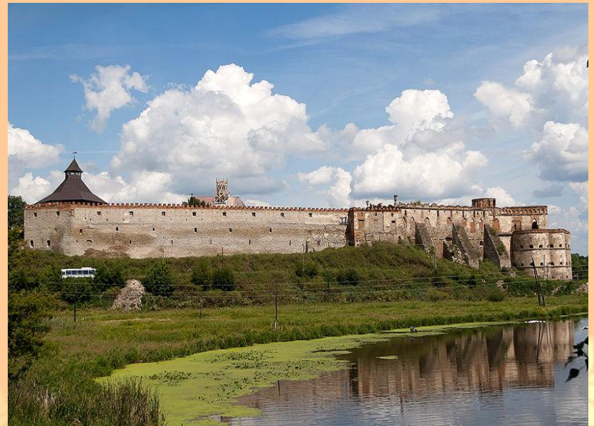
Меджибізький замок (Хмельницька обл.)