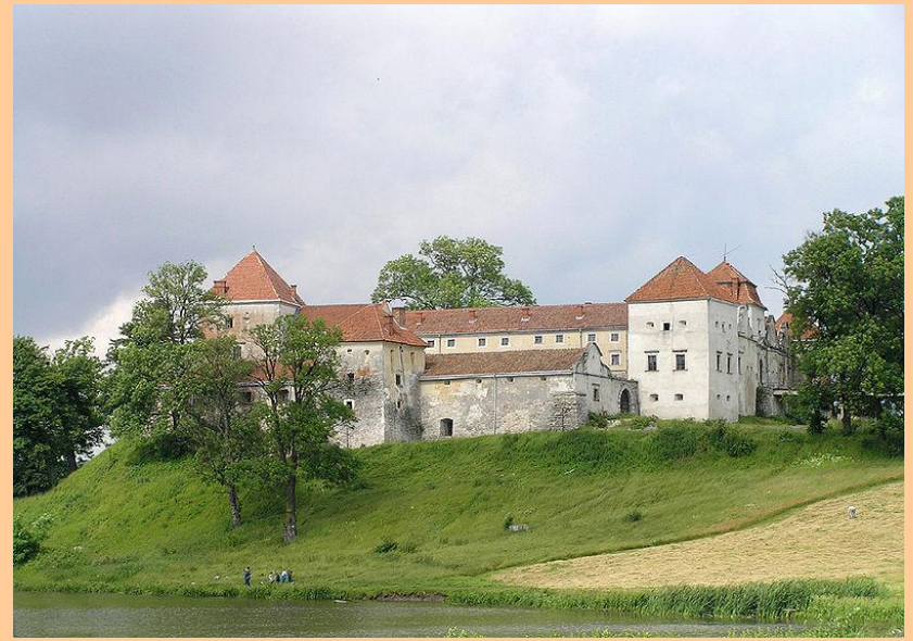
Свірзький замок (Львівська обл.)