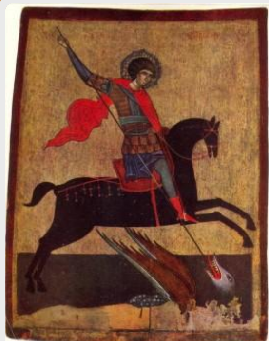
114. Кипи Звиропца. Икона в Стамбуле. Конец XIV в.