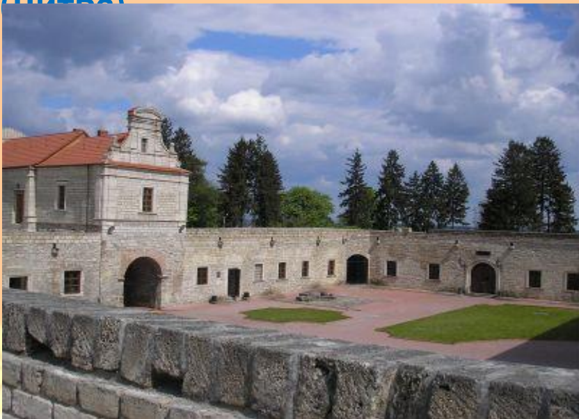
Збаразький замок(Тернопільська обл.)