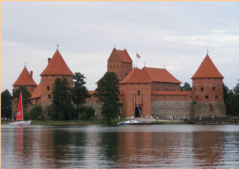
Тракайський острівний замок (Литва)