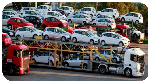
Автомобілі легкові, МОТОЦИКЛИ