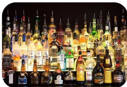
Спирт етиловий та інші спиртові дистилати