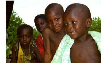
Багато меланіну у шкірі, широкий ніс, товсті губи, кучеряве волосся – пристосування до дуже жаркого і сонячного клімату