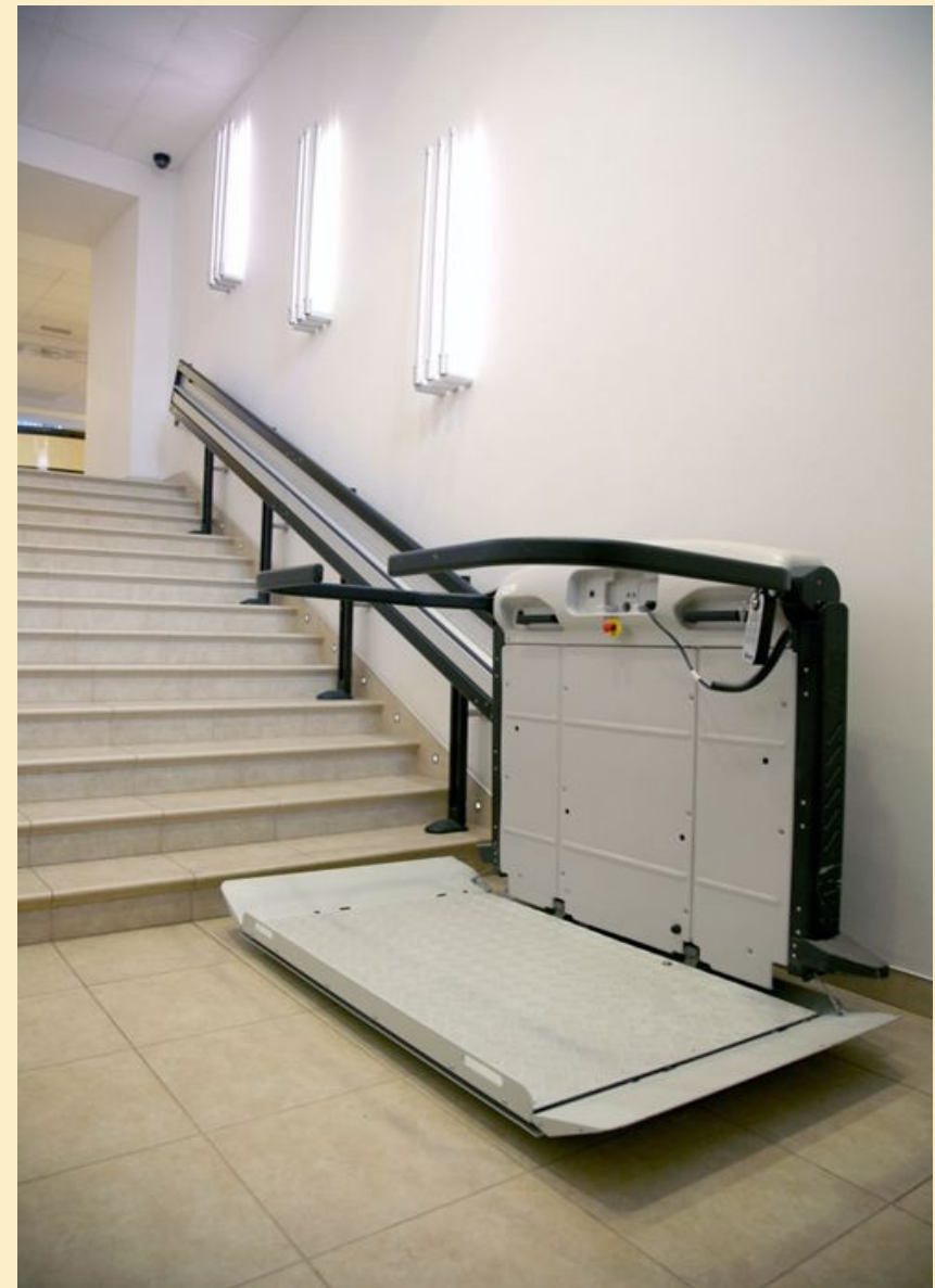
Стационарный лестничной подъемник