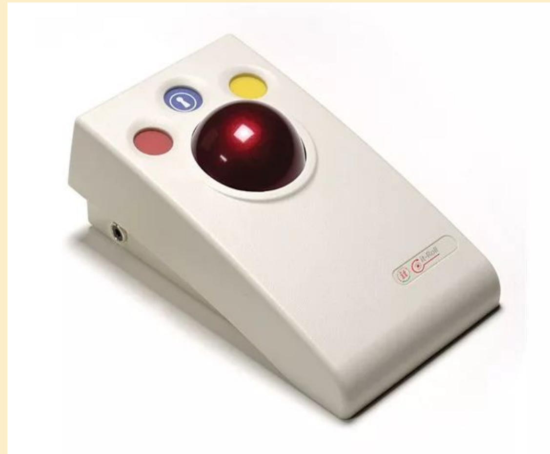
Роллер компьютерный Trackball SimplyWorks