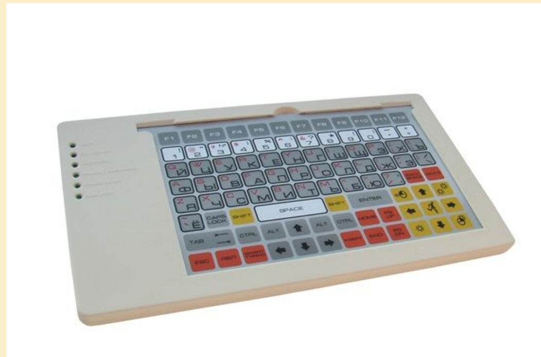
Клавиатура большая программируемая Клавинта