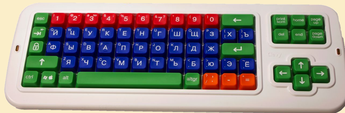
Клавиатура Clevy с большими кнопками