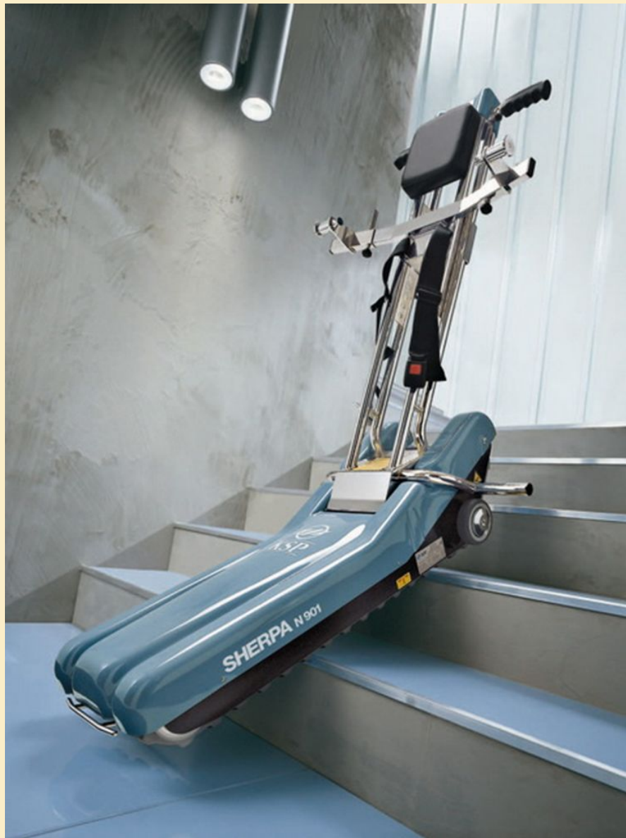
Мобильный лестничной подъемник