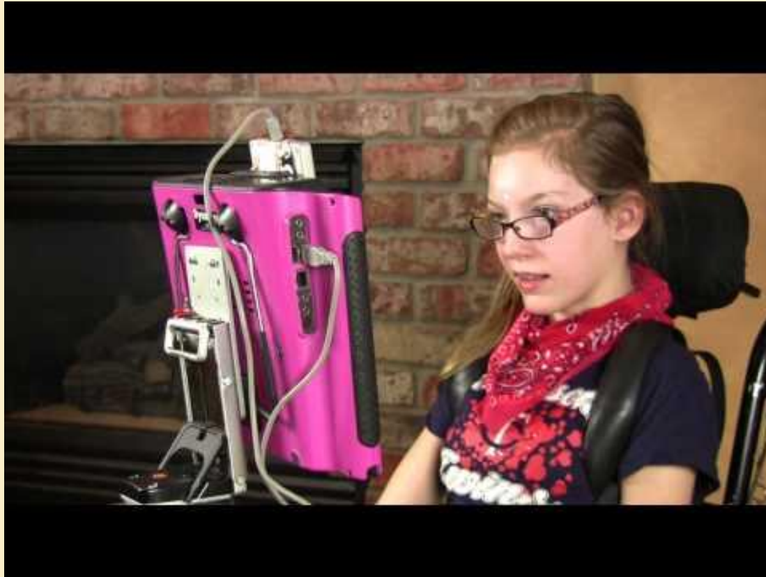
Desktop SenseView DSV