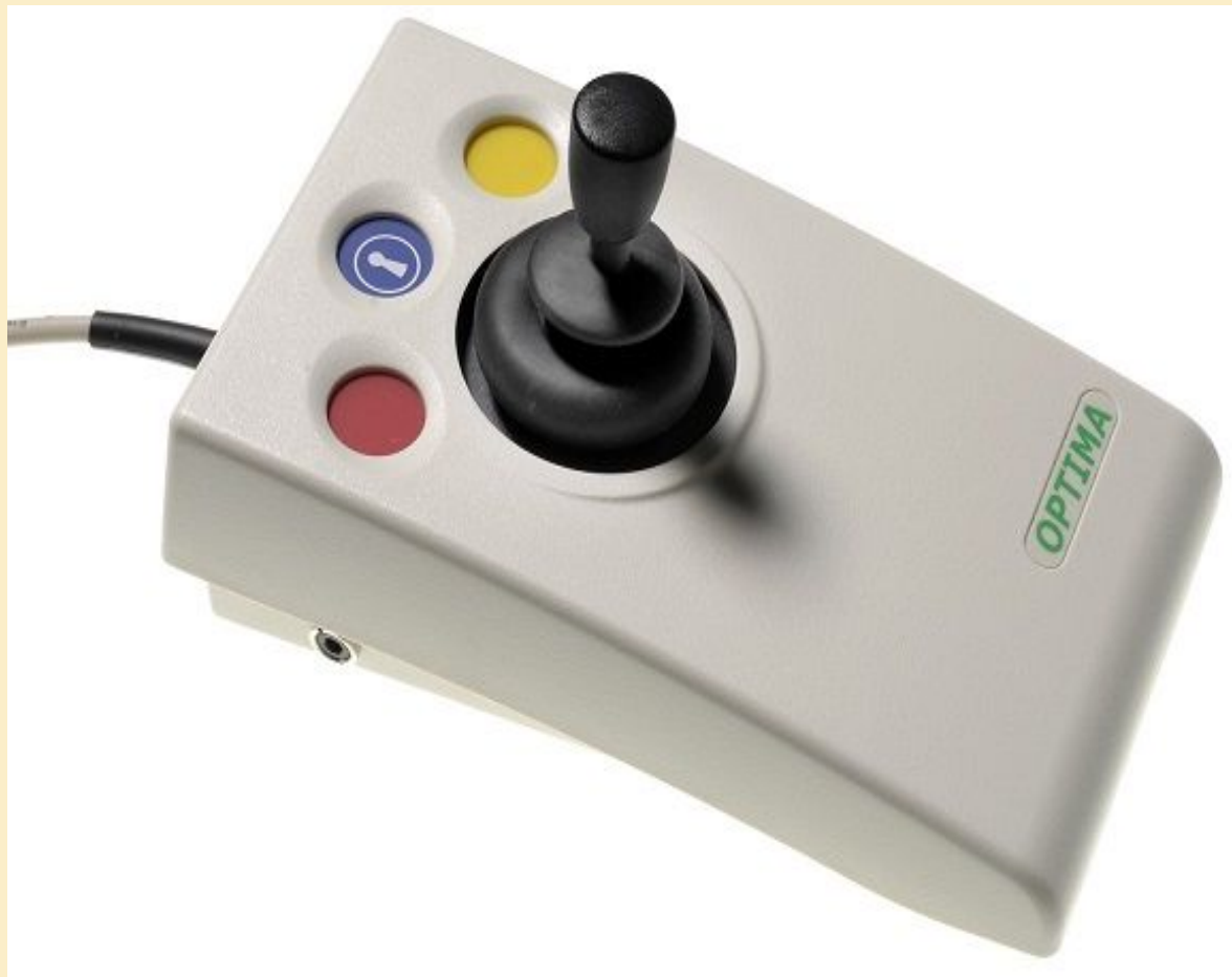
Альтернативная мышь — джойстик