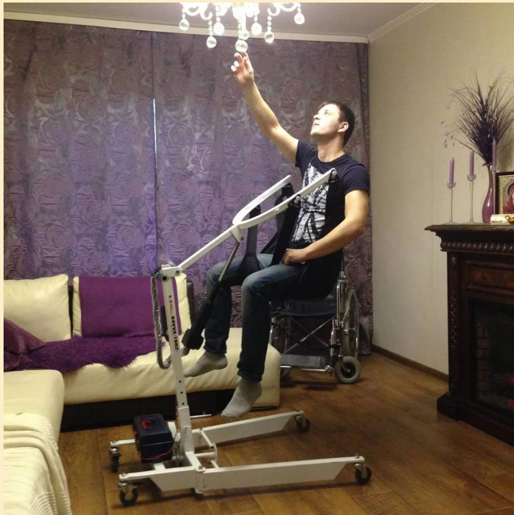
Универсальный подъемник «Minik»