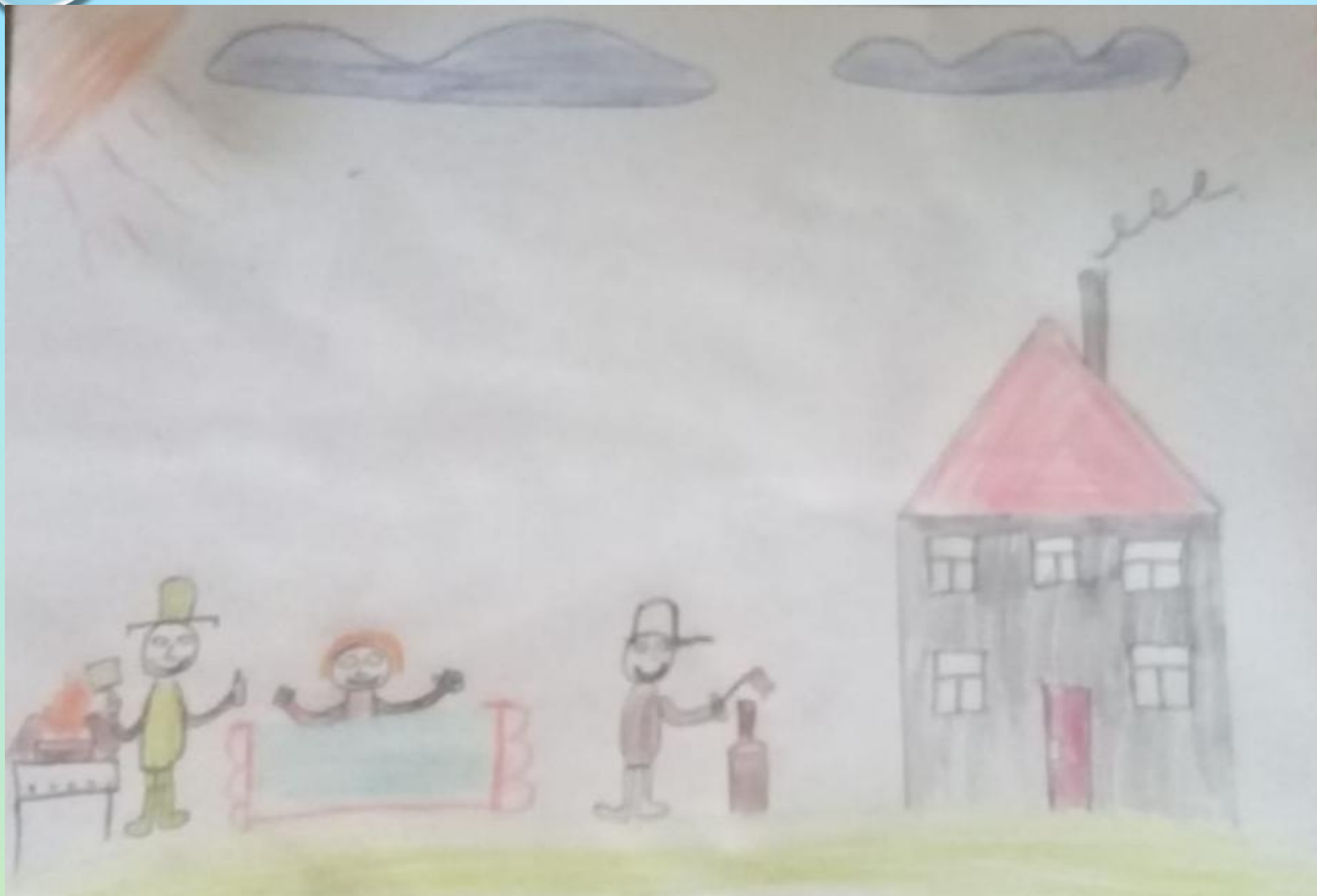
Зацепин Ярослав, 4 кл.