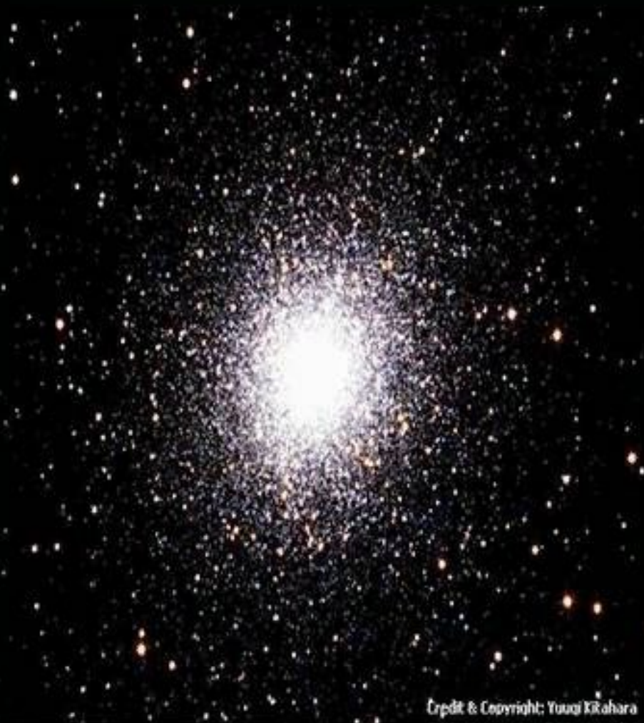
Рассеянное звездное скопление