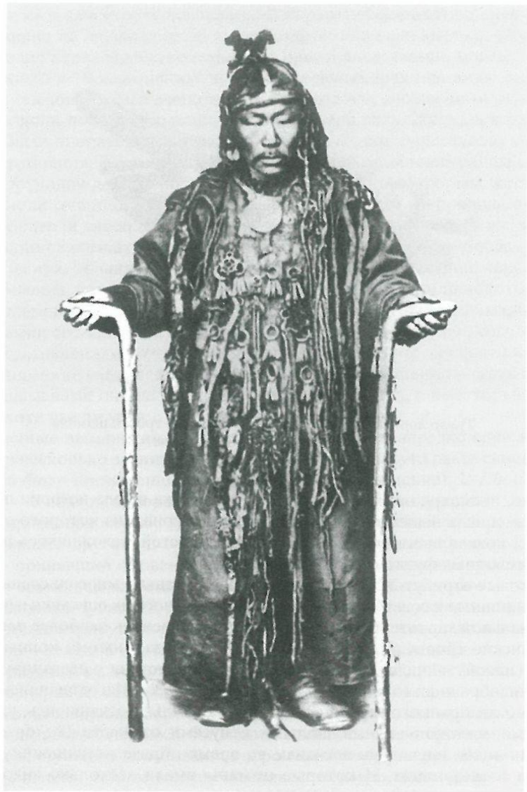
Ритуальное облачение шамана. Бурятия. Начало XX в.