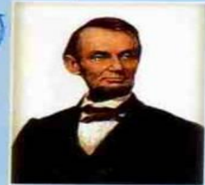
Авраам Лінколн – президент США в 1861–1865 рр.

1865 – Набрала чинності прокламація А. Лінколна про звільнення всіх рабів у США