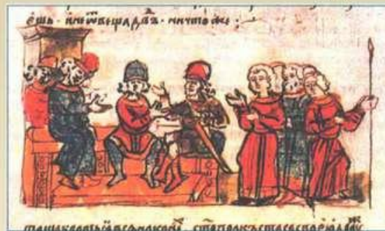
З'їзд руських князів під Києвом. Мініатюра з Радзивілівського літопису