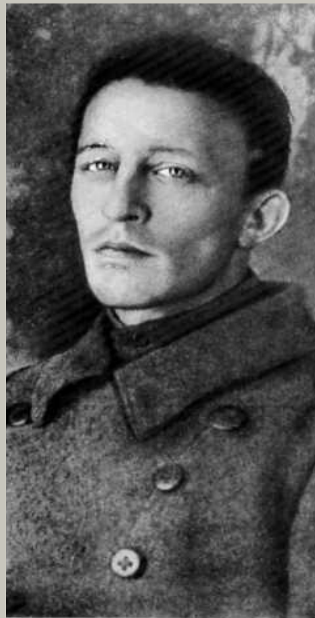
А. Александр Блок. 1918 год.