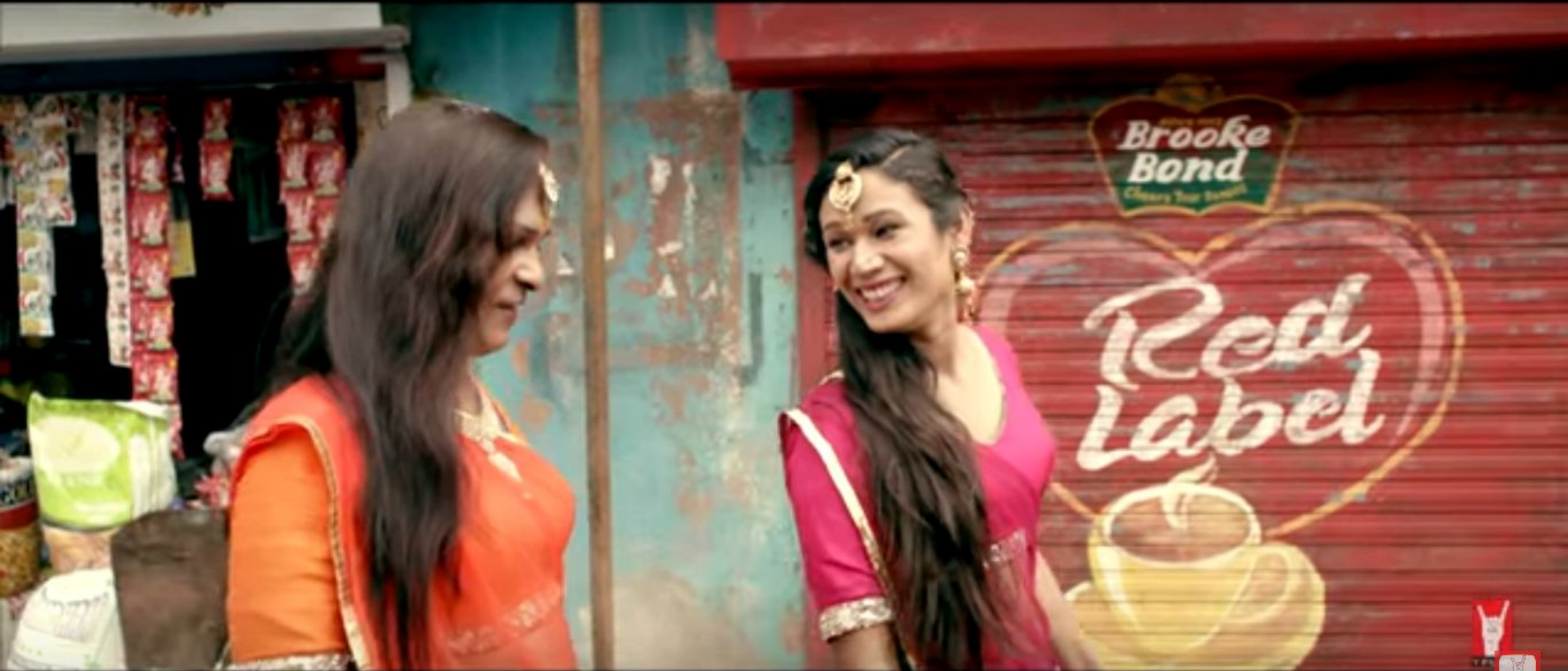
In India, the 'hijras' are a community almost in exile.