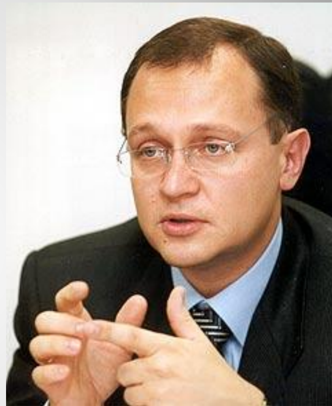
Сергей Владименович Кириенко, Премьер-министр

Курс рубля к доллару к осени 1998 г. снизился в четыре раза.