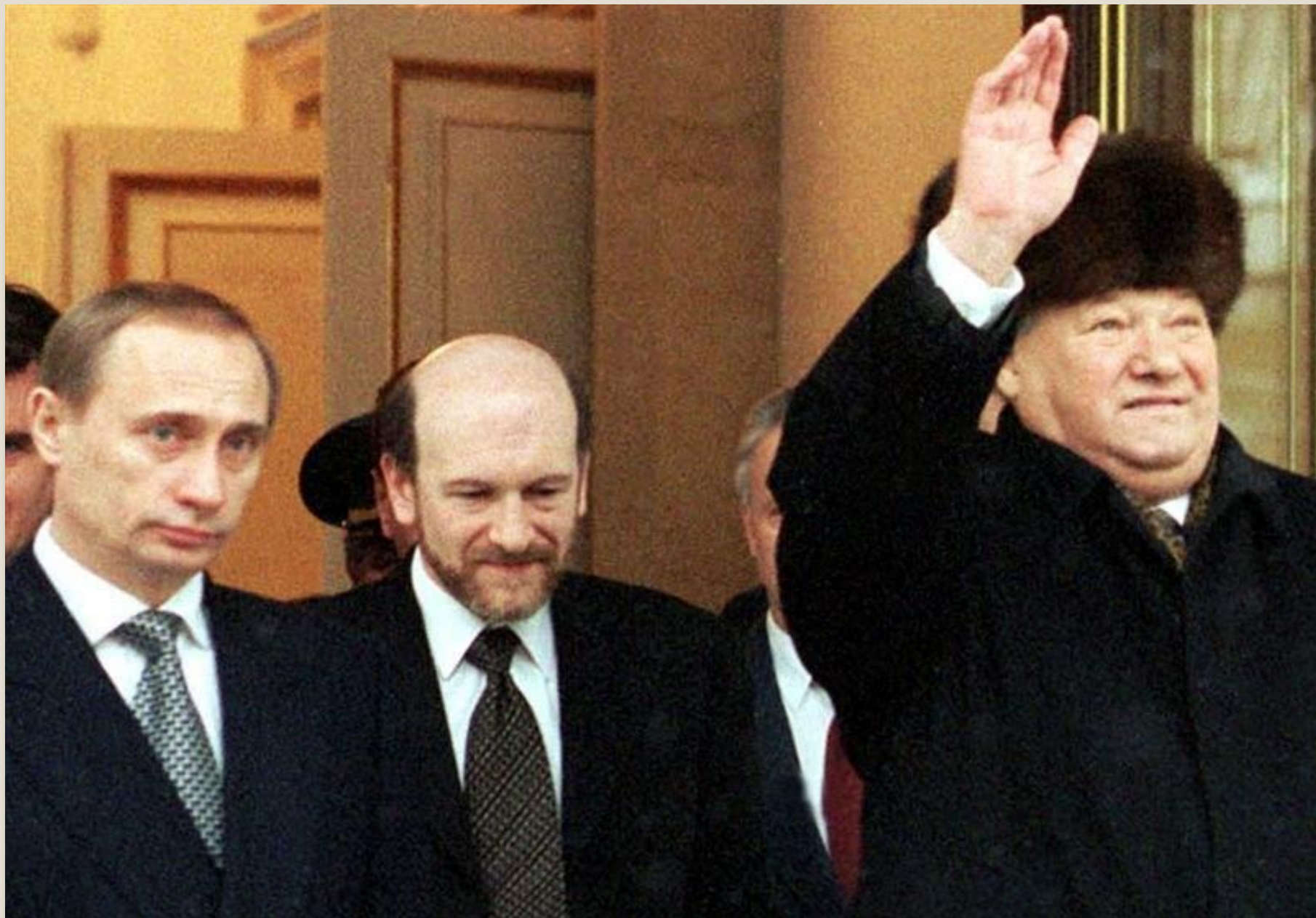
Б.Ельцин покидает Кремль, 31 декабря 1999 год.