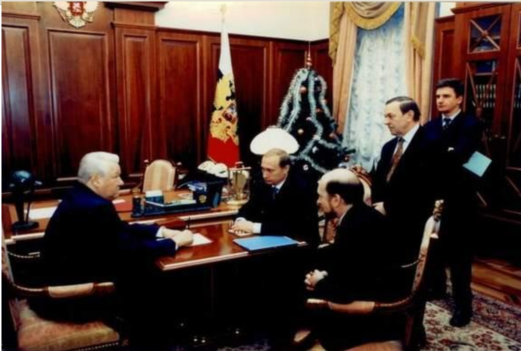
Утро 31 декабря 1999 года в кабинете президента в Кремле.