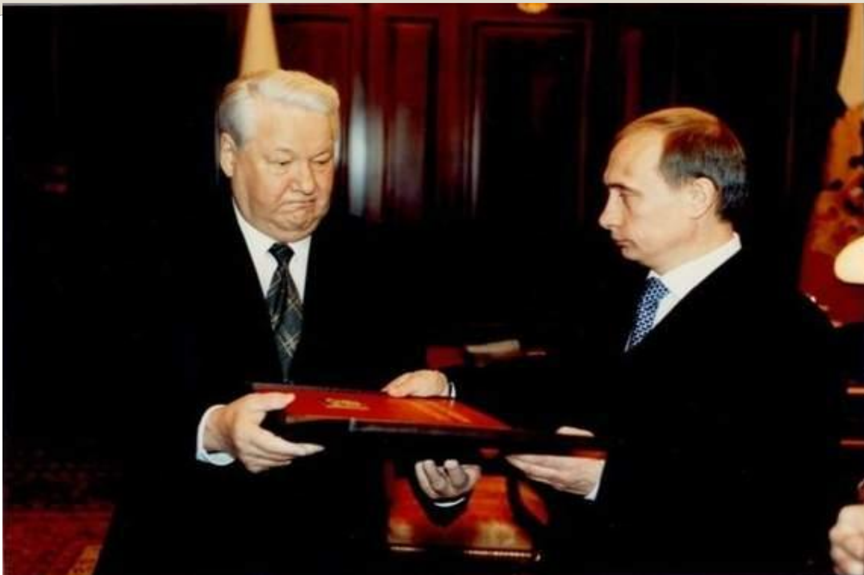
В папке указ президента о назначении премьер-министра В. В.Путина исполняющим обязанности Президента России.