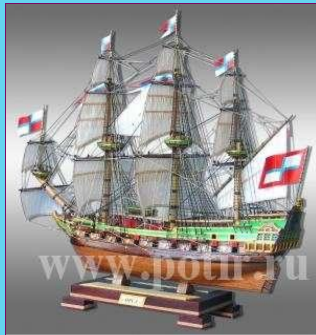
Макет корабля «Орёл»