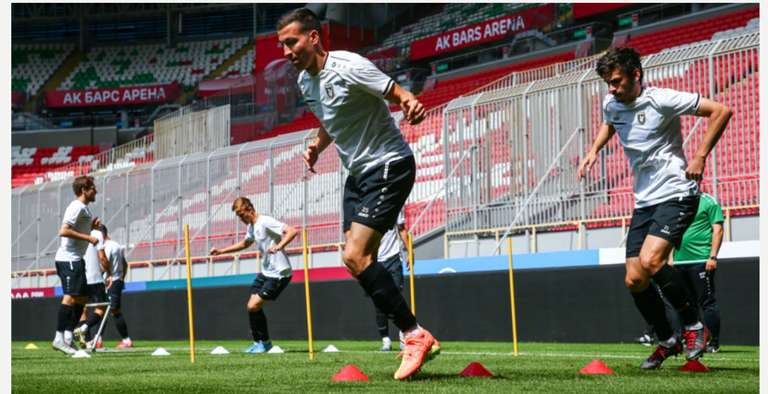
*Football club "Rubin" training in Ak Bars Arena

The construction of the arena was spent 15.5 billion rubles. Almost 3 thousand workers worked on the construction of the stadium.