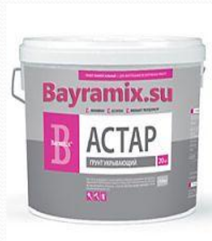
Грунт Астар укрывающий Bayramix