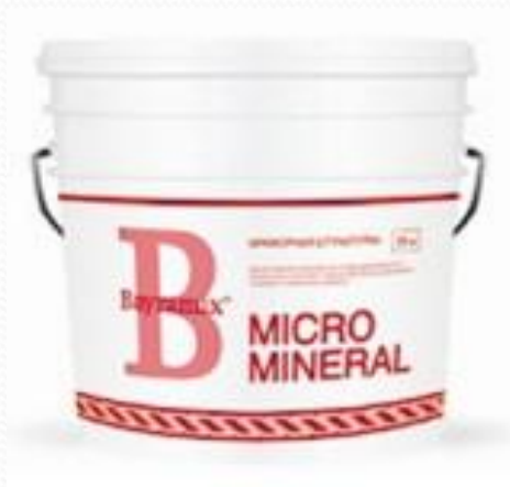
Штукатурка «Bayramix» Micro Mineral