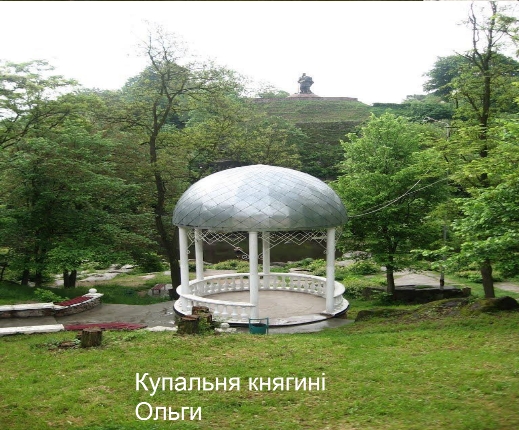
Купальня княгині Ольги

За літописами вже на початку X сторіччя Іскоростень, на місці якого і знаходиться Коростень, був могутнім містом, постійною резиденцією древлянського князя Імела. Місто згадується в літописах у зв'язку з придушенням князем Ігорем повстання древлян. Сусіднє село Поліське багато століть звалось Могильним: за переказами, саме там поховали древляни убитого князя Ігоря, насипавши на його могилі курган.