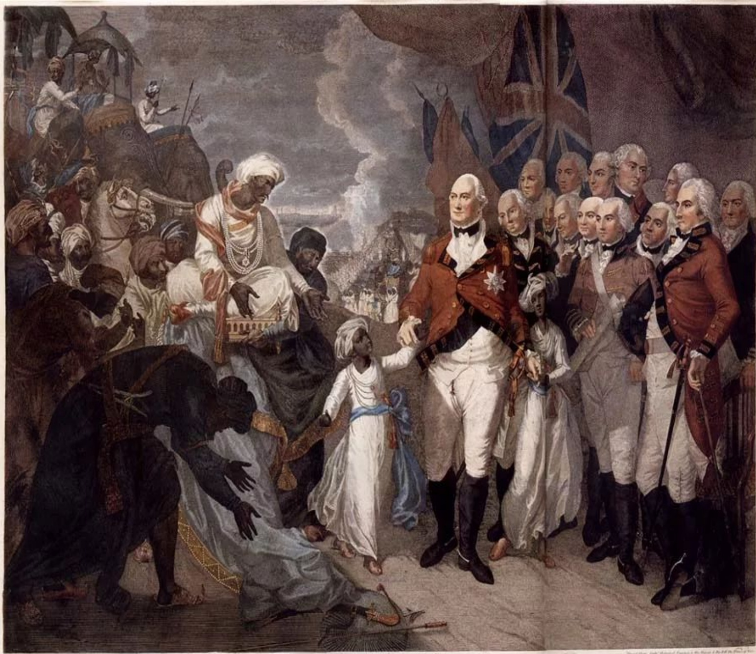
To the Honble the East India Company This Copy of the Treaty of Calcutta is the same as the original which was sent to the Honble the East India Company on the 24th of September 1757 and is now deposited in the Museum of the Honble the East India Company at the India Office London

В 1600 г. была учреждена английская Ост-Индская компания («Компания купцов Лондона, торгующих в Ост-Индии ») для установления торговых отношений с Востоком , которая впоследствии получила право проводить собственную коммерческую, политическую и военную деятельность в Индии