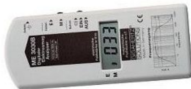
Obr. 11.17 Pohľad na merací prístroj

Presnosť: < \pm 2\% pri 100 nT alebo V/m.