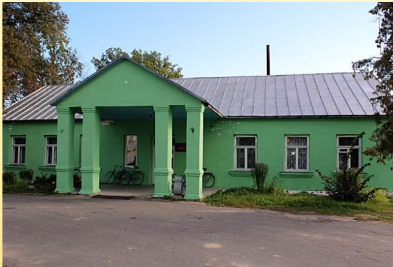
На фота адміністрацыйны будынак КУВСП імя Маркава (былы маёнтак паноў Бароўскіх)

(запісана ад Ардынскай Людмілы, в. Радзюкі, 70 гадоў)