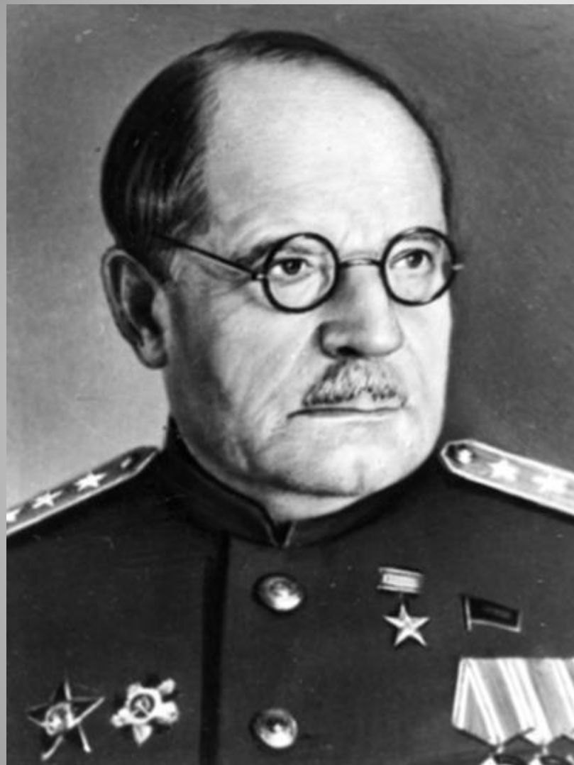
Николай Нилович Бурденко (1876-1946)