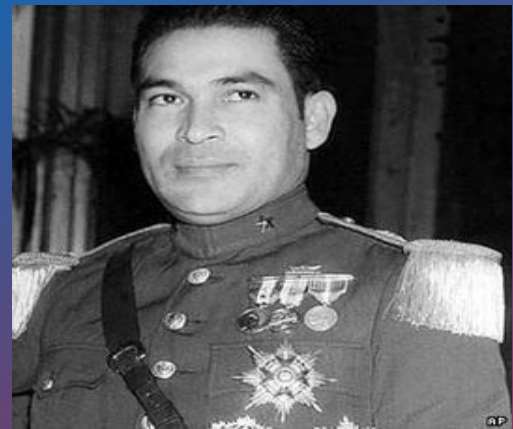
Фидель Кастро (1959-2008гг)