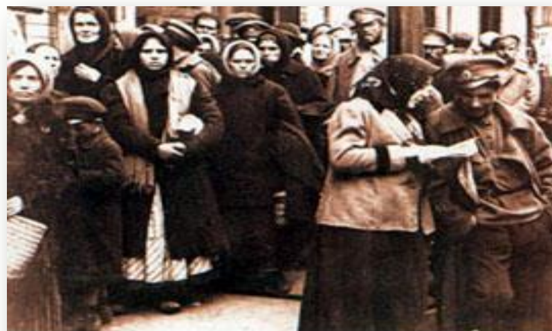
Очередь у продовольственного магазина. Петроград. 1917 г.