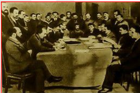
Заседание Исполкома Петросовета (февраль 1917 г.)