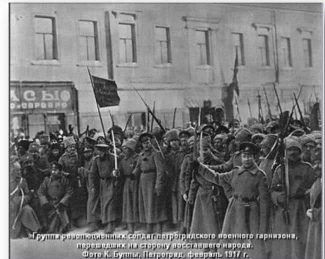
Группа революціонныхъ солдатъ петроградскаго военнаго гарнизона, перешедшихъ на сторону восставшаго народа. Фото К. Булыга, Петроградъ, февраль 1917 г.

В ночь с 26 на 27 февраля к рабочим присоединились восставшие солдаты, утром 27 был сожжен окружной суд и захвачен дом предварительного заключения, из тюрьмы были освобождены заключенные, среди которых было немало членов революционных партий, арестованных в последние дни.