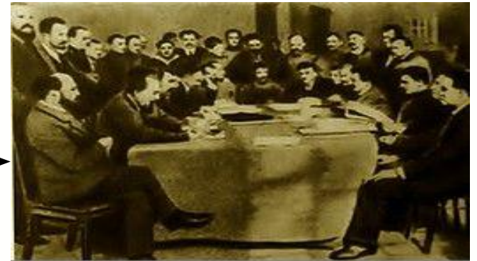
Заседание Исполкома Петросовета [февраль 1917 г.]

3 марта 1917 года создано Временное Правительство