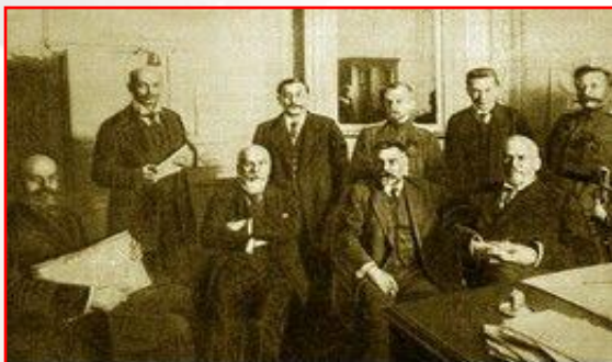
Временный комитет Государственной думы