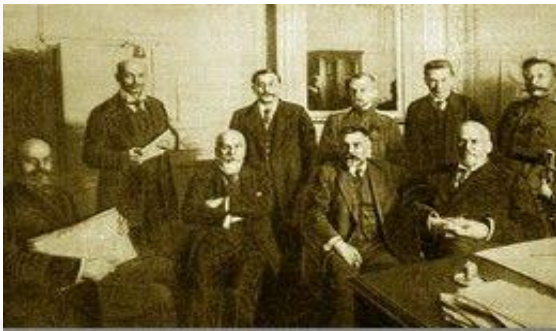
Временный комитет Государственной думы