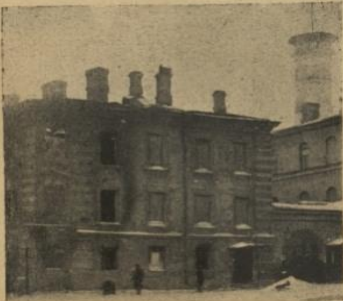
Сожженное здание полицейскаго архива и сыскаго отдѣленія на Екатерининскомъ каналѣ.

ЗВУКИ ПОЖАРОВЪ ПЕРВАГО ДНЯ РЕВОЛЮЦІИ 2: ФЕВРАЛЯ.