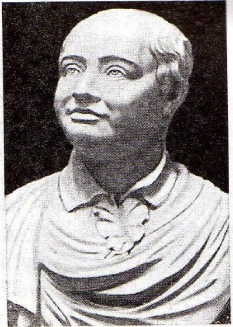
М. В. Ломоносов. Скульптор Ф. Шубин.