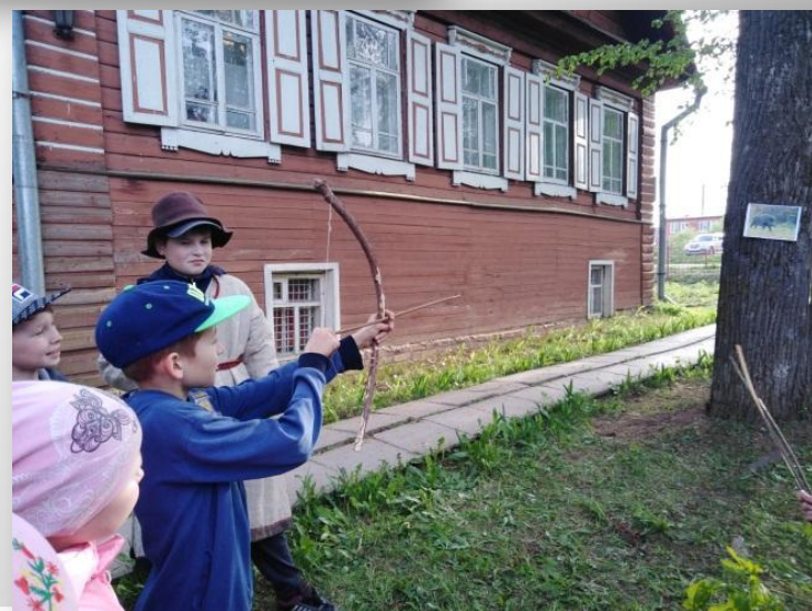
охотились на диких животных