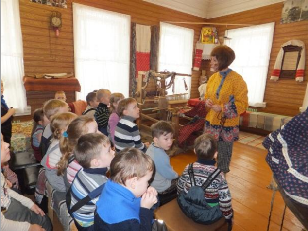
День рождения Домового»