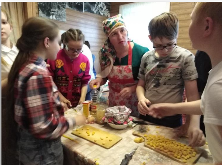
готовили татарские блюда