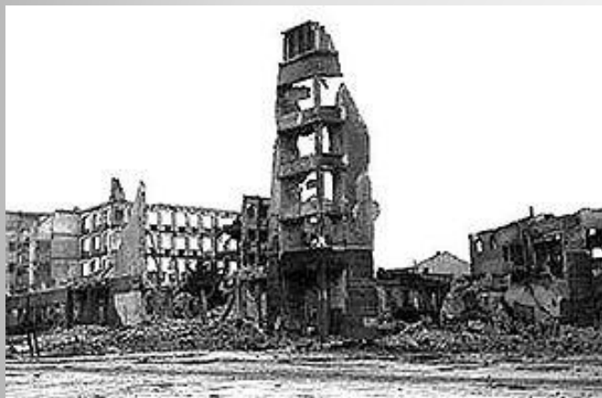
Руины Сталинграда 1943 г.

Сталинградская битва была одним из важнейших событий Второй мировой войны. Она продолжалась 200 суток. Сражение включало в себя попытку вермахта захватить левобережье Волги в районе Сталинграда (современный Волгоград) и сам город, противостояние в городе, и контрнаступление Красной армии (операция «Уран»), в результате которого VI армия вермахта и другие силы союзников Германии внутри и вокруг города были окружены и частью уничтожены, частью захвачены в плен. По приблизительным подсчётам, суммарные потери обеих сторон в этом сражении превышают два миллиона человек.