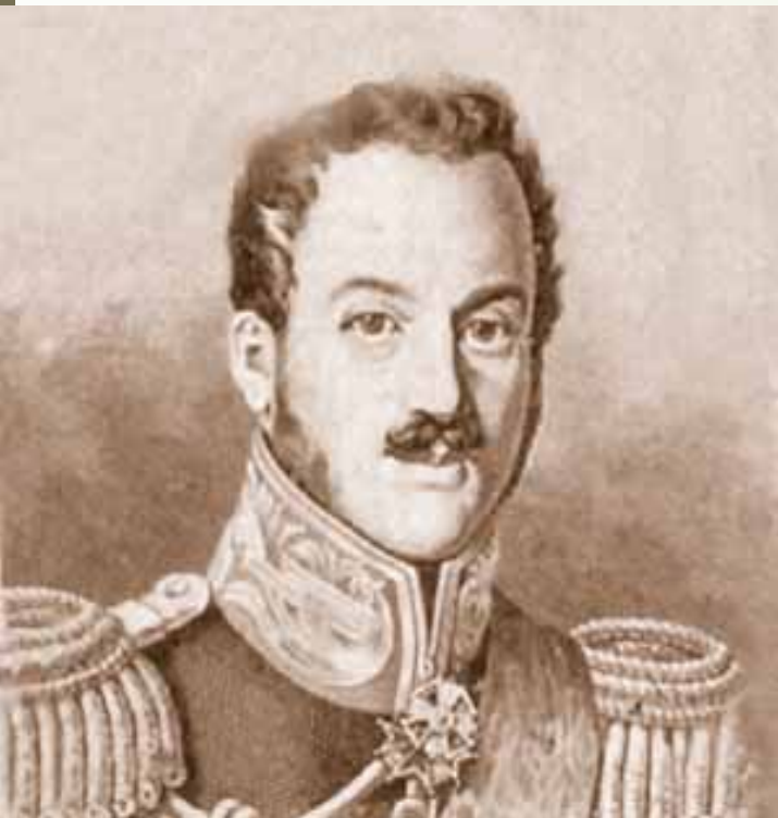
граф Павел Киселев