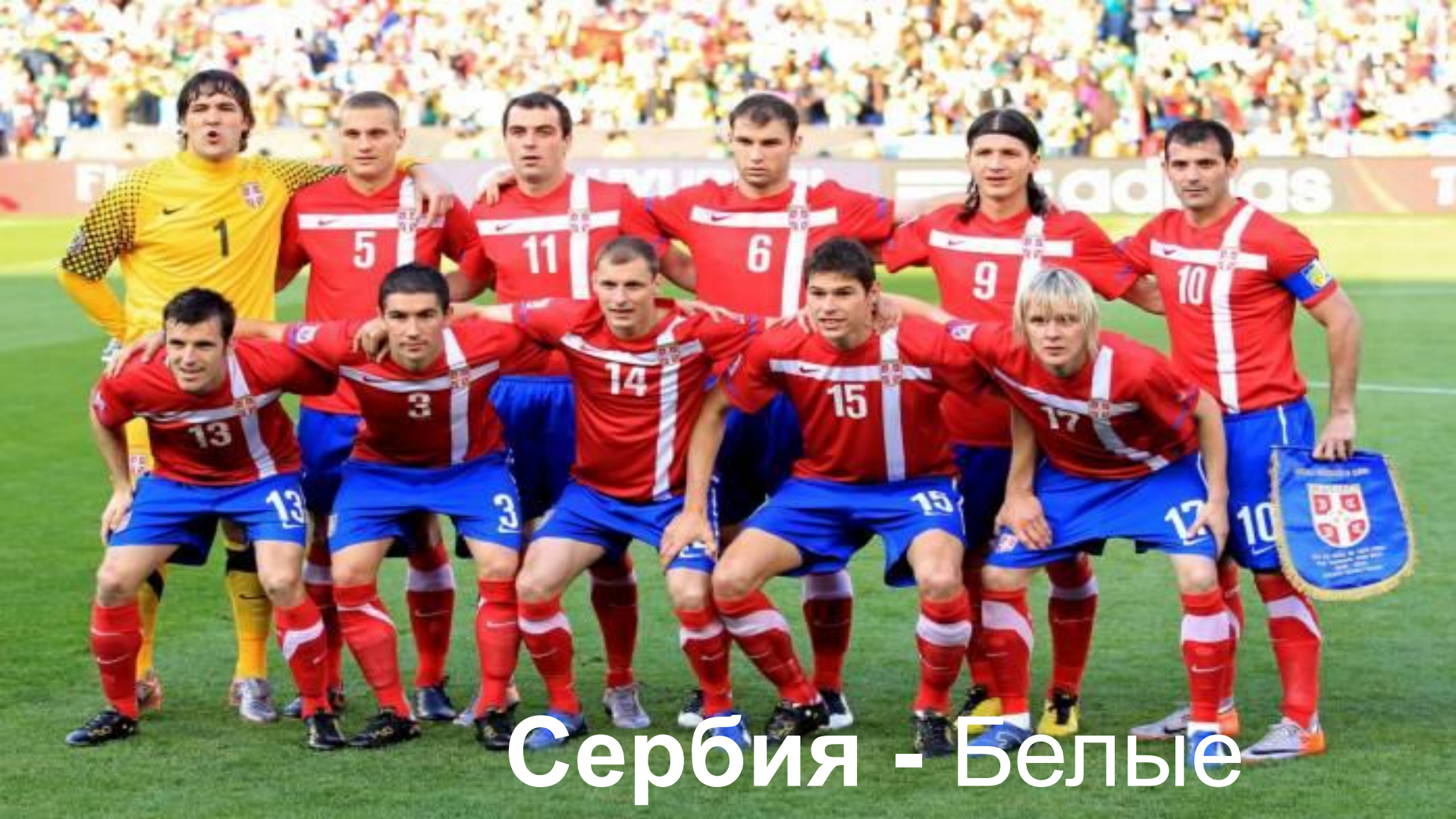
Сербия - Белые