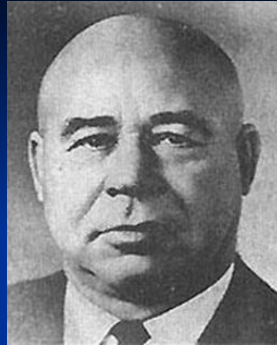
Петро Юхимович Шелест , український державний діяч, перший секретар ЦК Компартії України (1963-72 рр.)