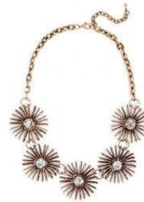
FLOWER NECKLACE BAUBLE BAR