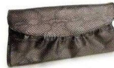
BRONZE CLUTCH MILANOO