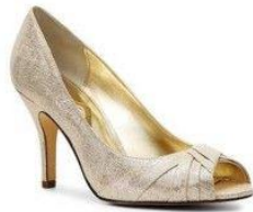
FULTAN PUMP NINA