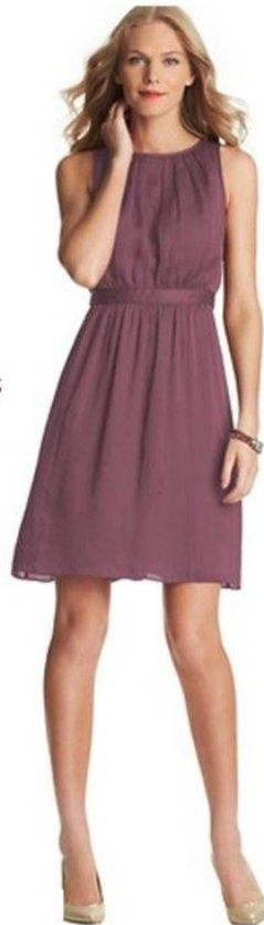
PLEATED DRESS BY LOFT