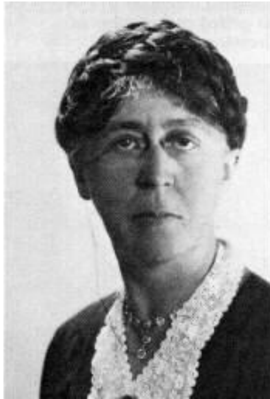
Мэри Паркер Фоллет (1868 - 1933)