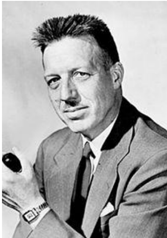
Дуглас Мак- Грегор (1906-1964)