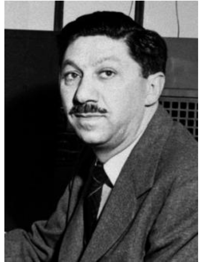
Абрахам Маслóу (1908 – 1970)