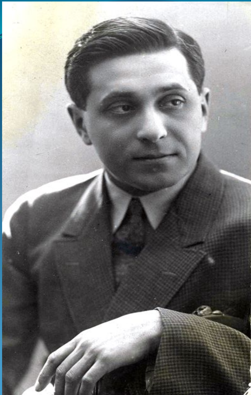
Михаил Михайлович Зощенко