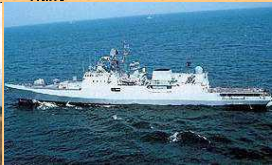
Індійський військовий корабель "Табар"