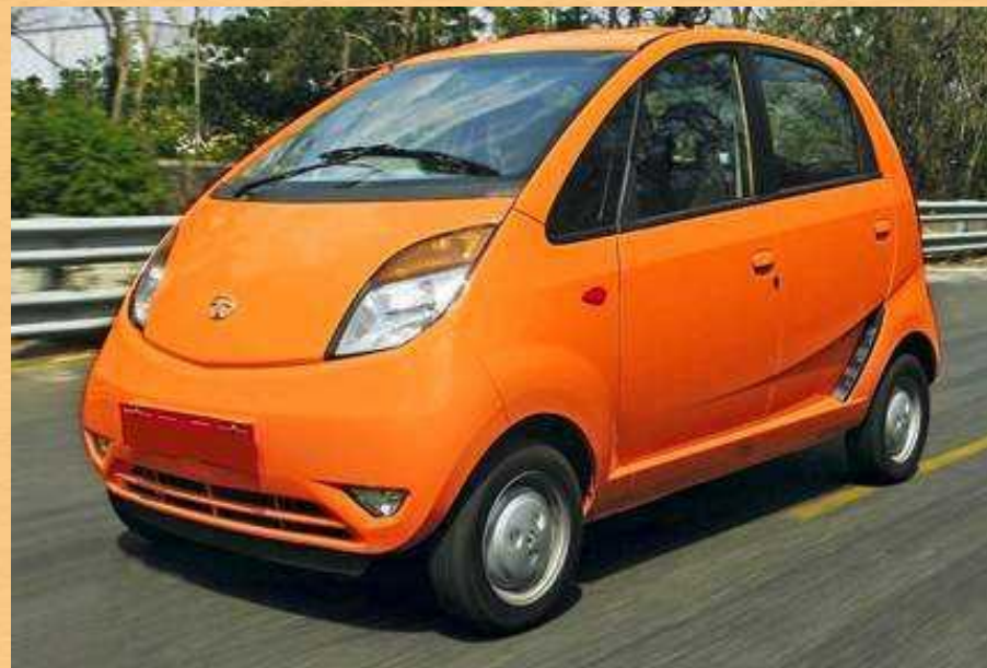
Індійський автомобіль «Tata Nano»

Розвинений авіаційний, автомобільний, морський та річковий транспорт.