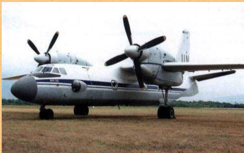
Ан-32. ВВС Індії