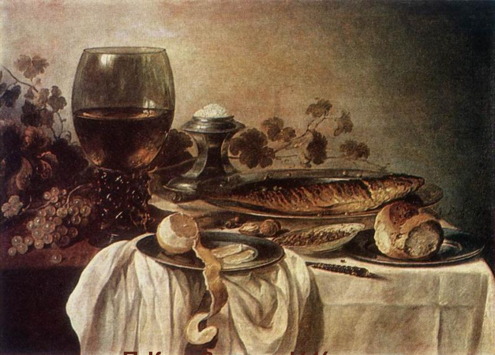
П. Клас. Завтрак. 1646 г.