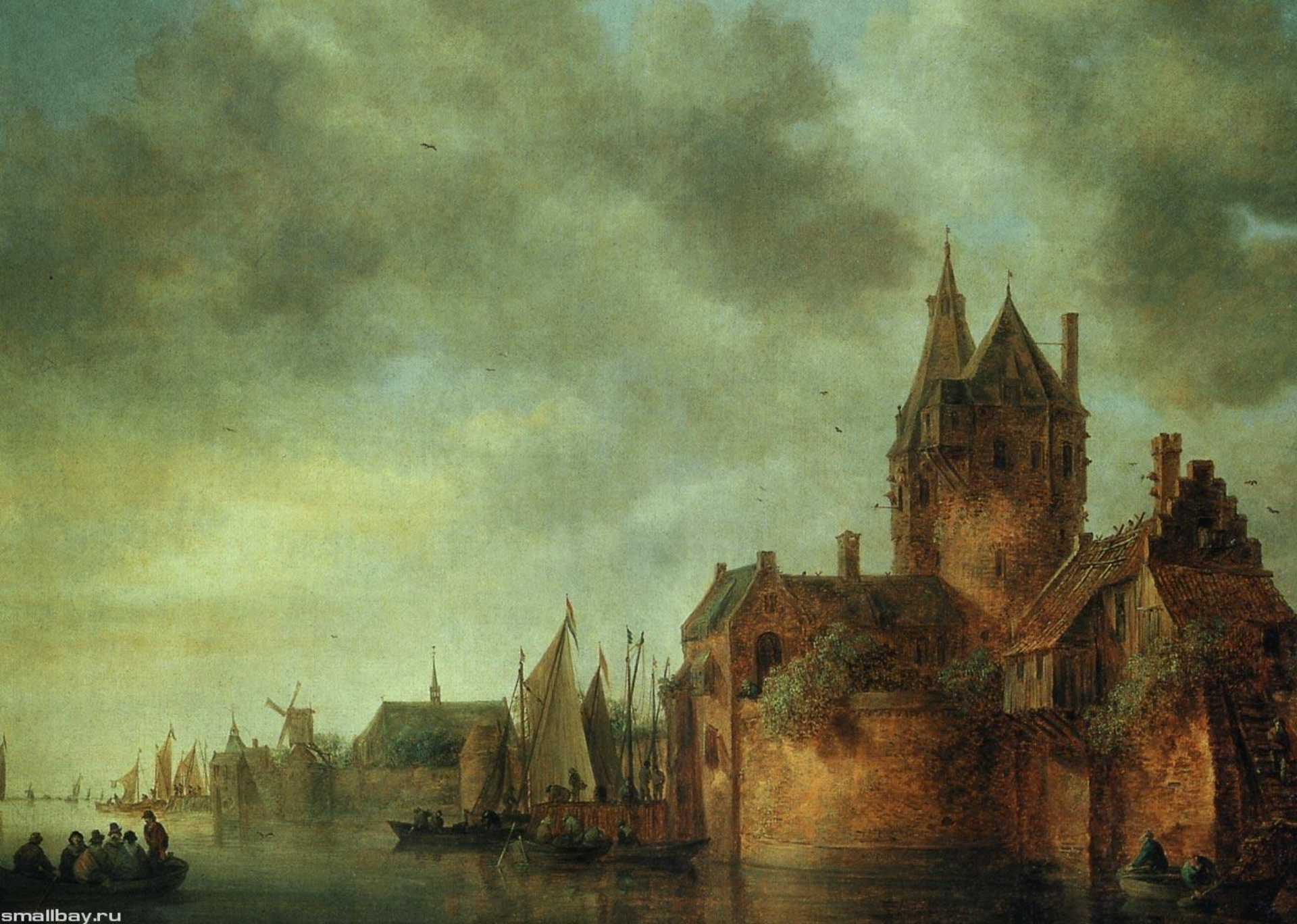
Ян ван Гойен. Замок на реке с лодками у причала. 1645 г.