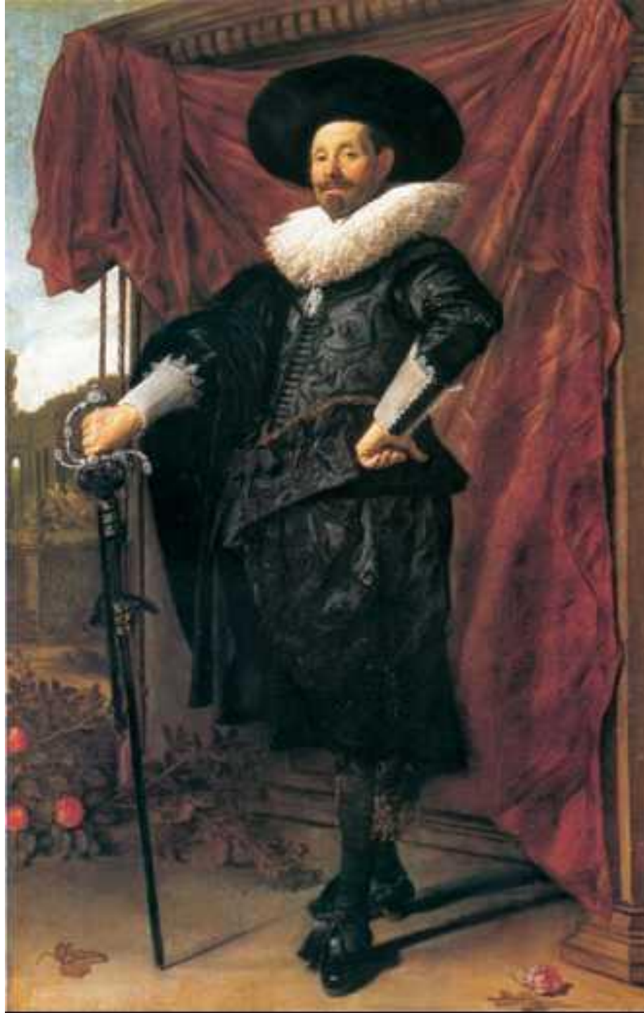
«Портрет Виллема ван Хейтхейзена» 1626 г.