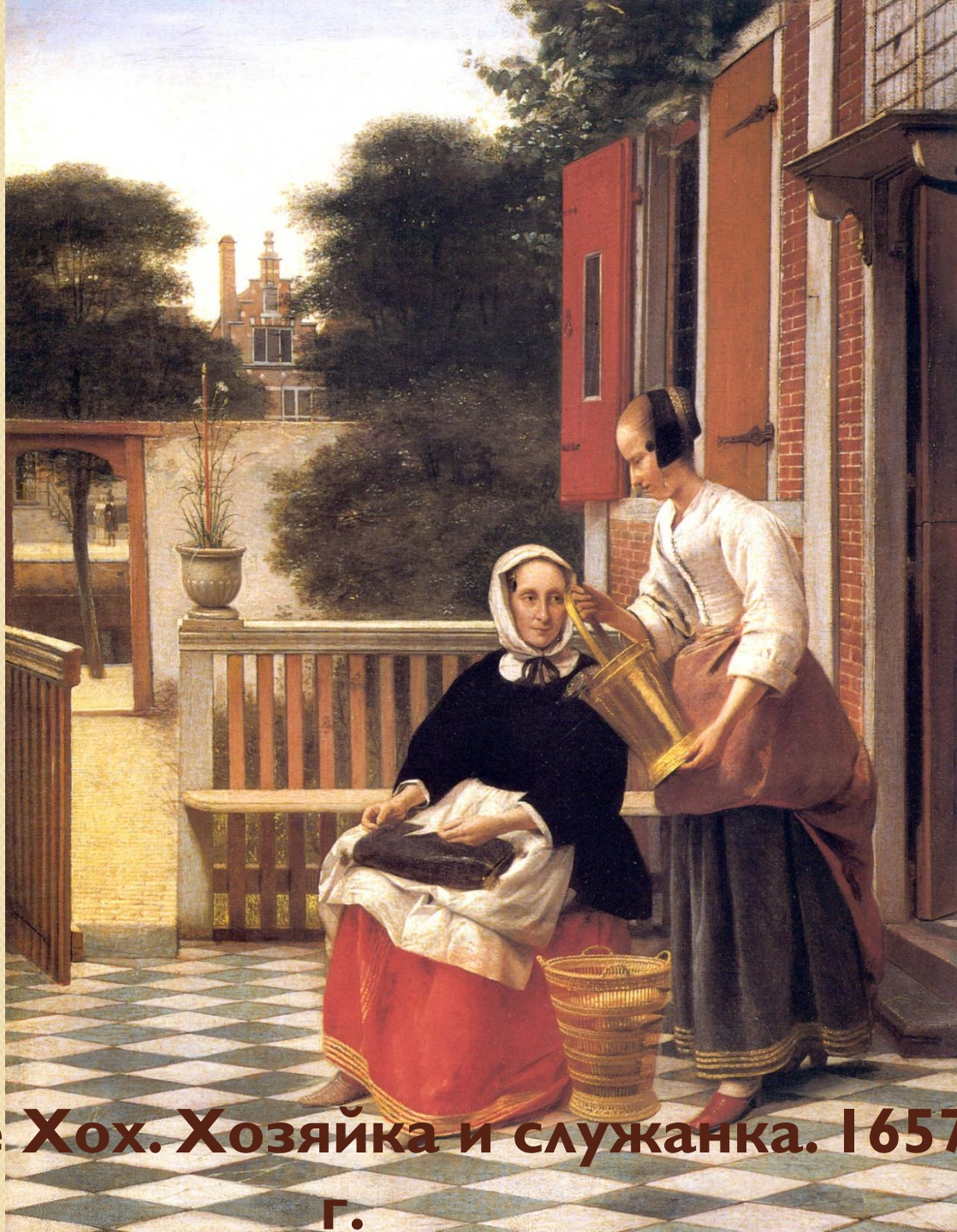
Питер де Хох. Хозяйка и служанка. 1657