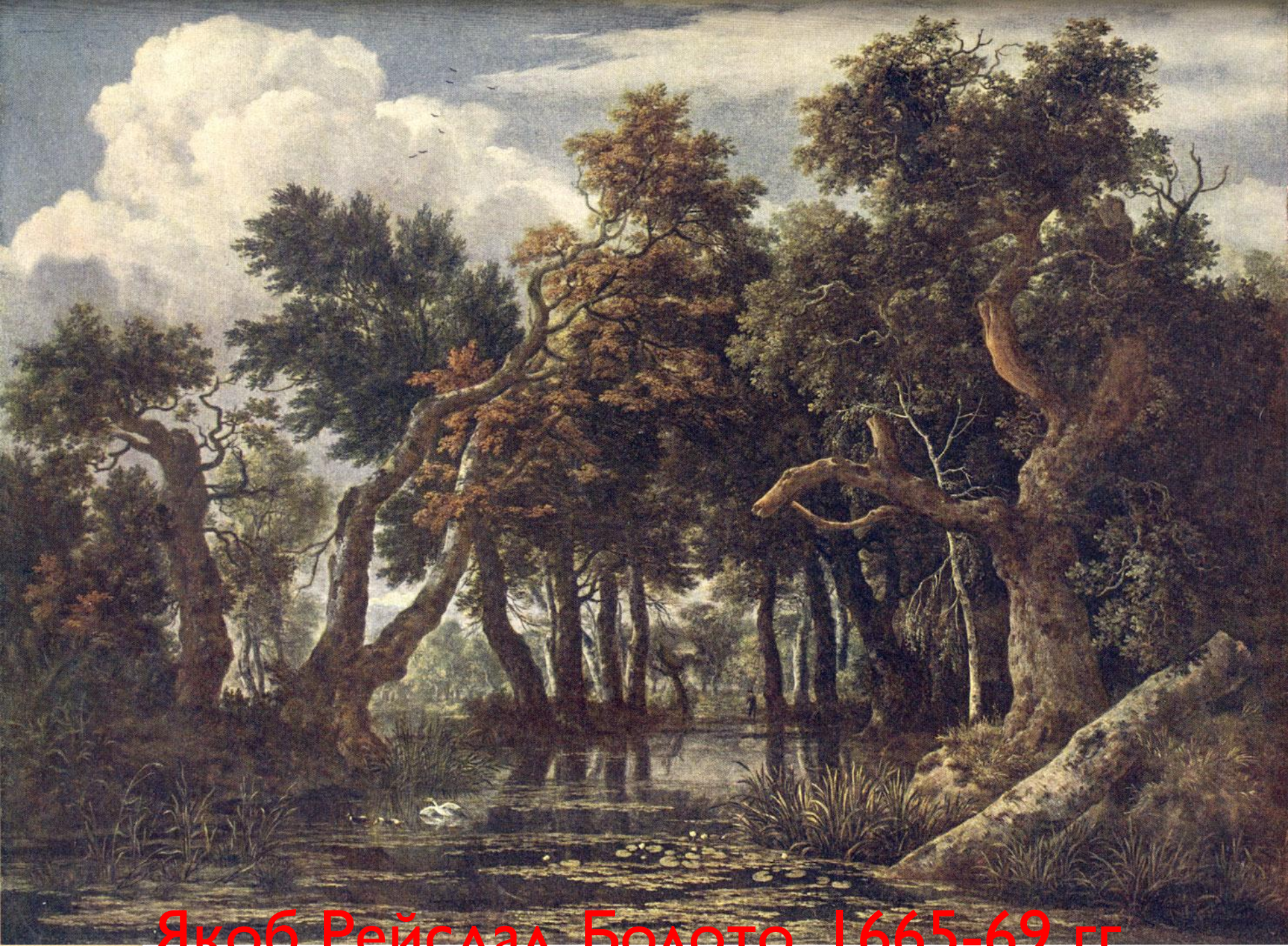
Якоб Рейсдал. Болото. 1665-69 гг.