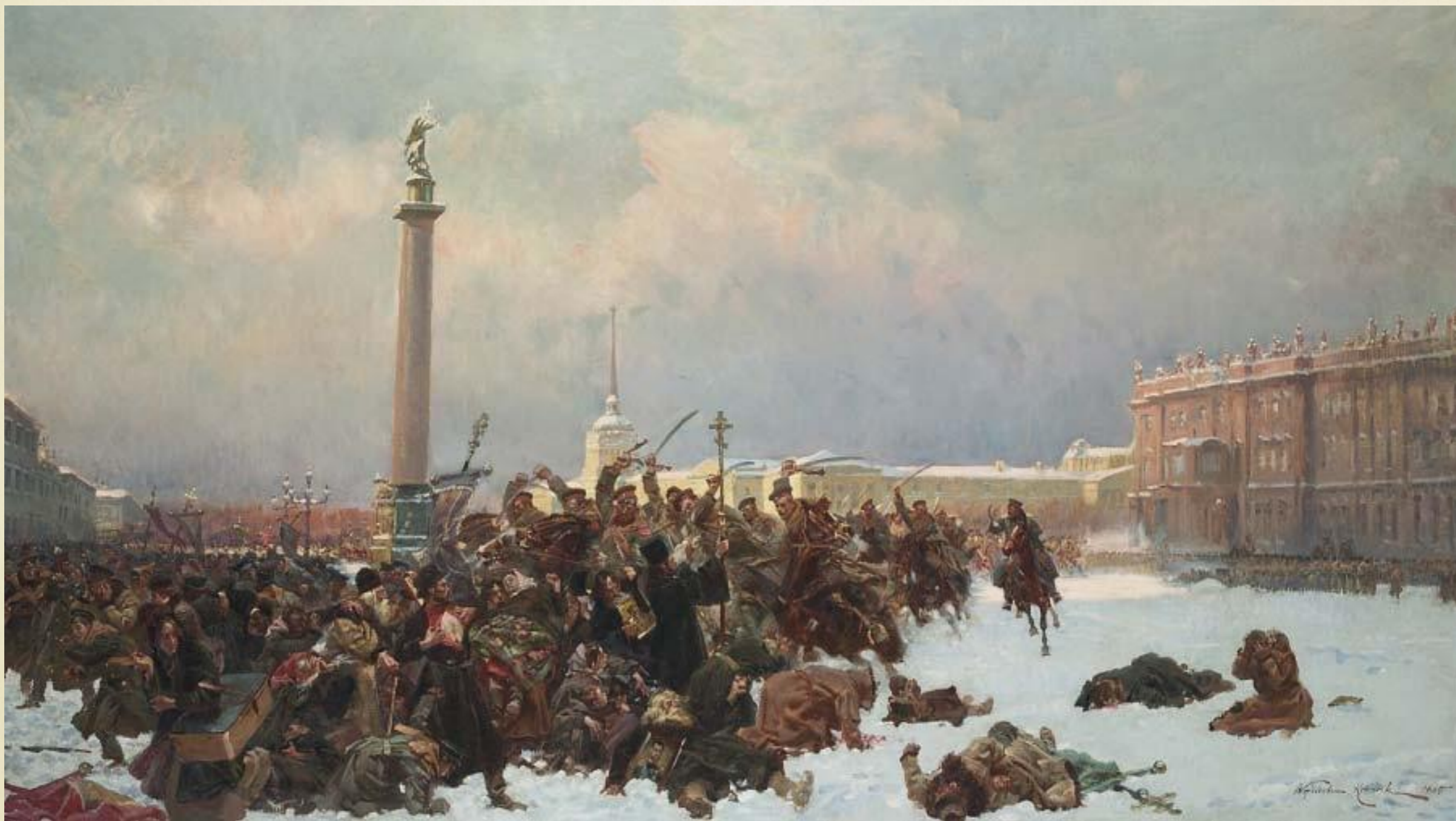
«Кровавое воскресенье в Петербурге 9 января 1905 года» Войцеха Горация Коссака