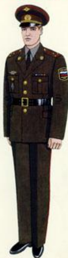
Повседневная для строя