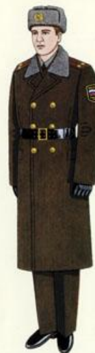
Повседневная для строя