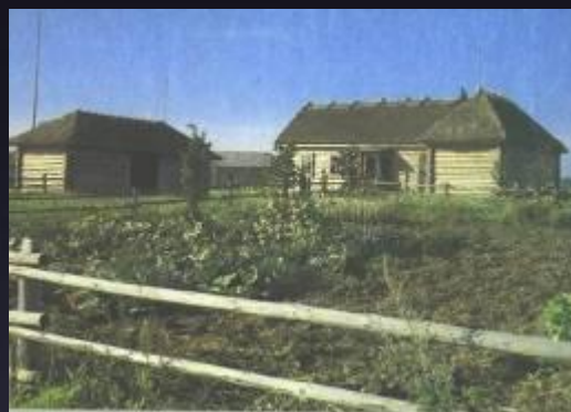
Хутор Загорье. Музей Твардовского