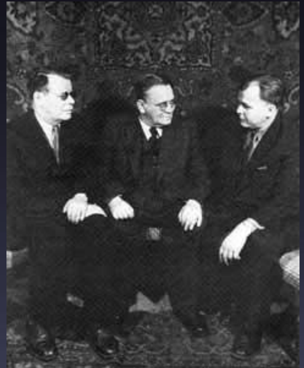
М. Исаковский, С. Маршак, А. Твардовский. 1953г