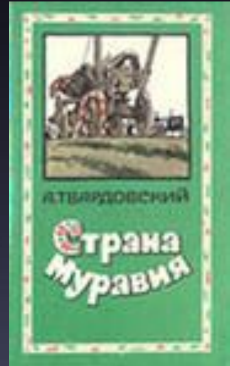
Иллюстрация к поэме «Страна Муравия»