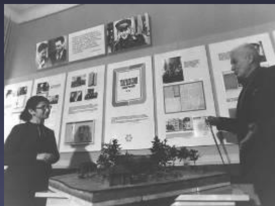
В музее Твардовского