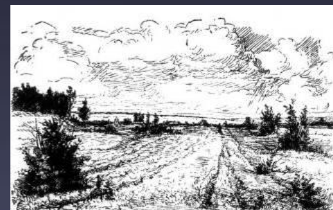
Иллюстрация к поэме «Страна Муравия», 1936г