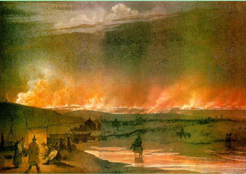
Пожежа в степу. 1848