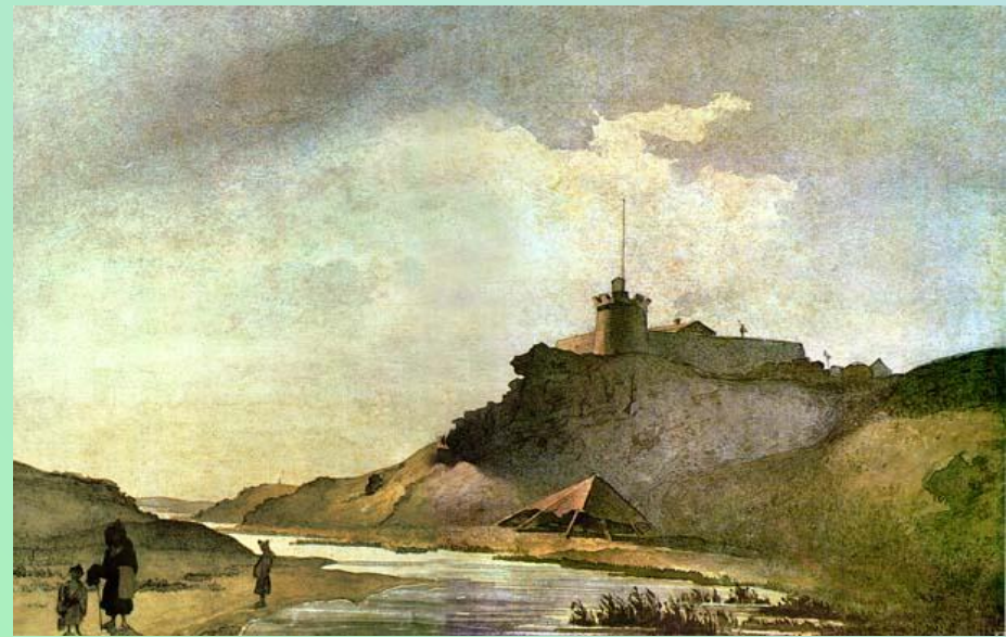
Форт Кара-Бутак. 1848-1849