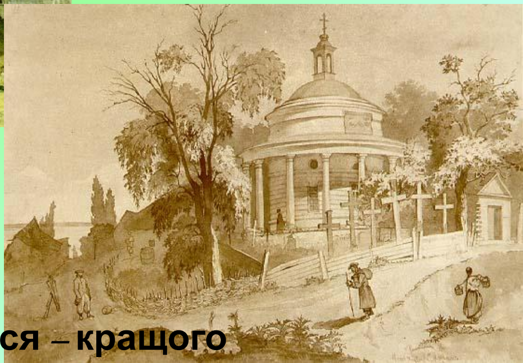
Аскольдова могила у Києві 1846