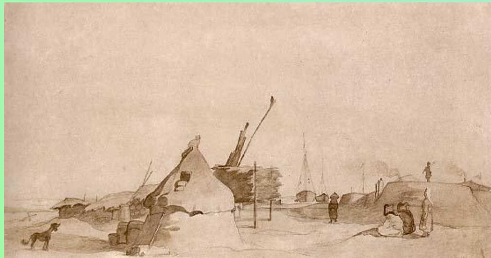
Форт Кос-Арал зимою. 1848-1849