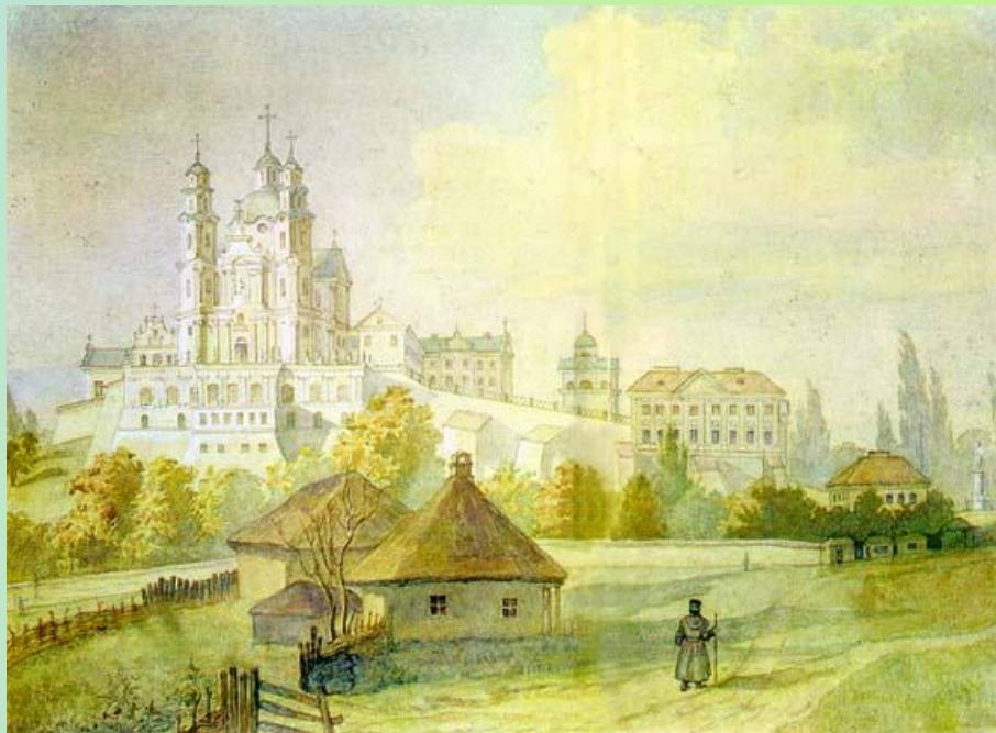
Почаївська лавра, 1846