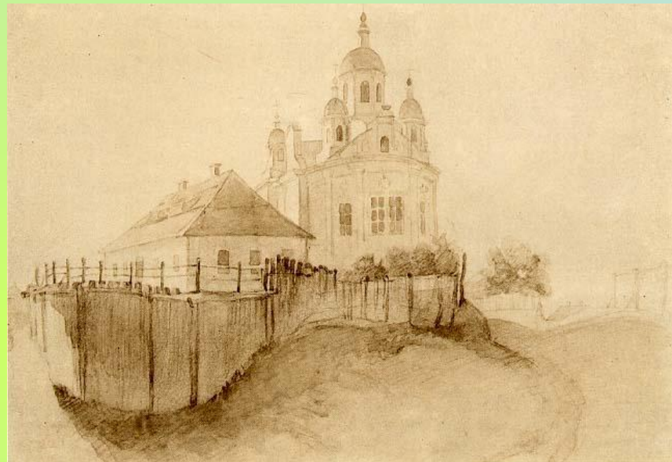
Будинок І.Котляревського в Полтаві, 1845