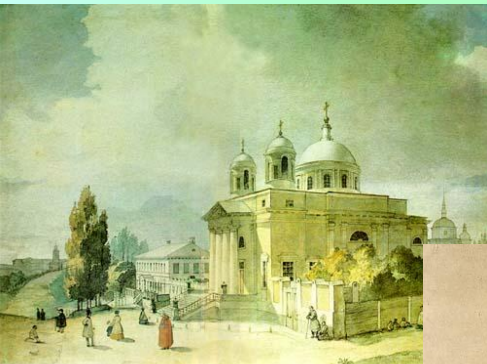
Романо-католицька церква у Києві 1846