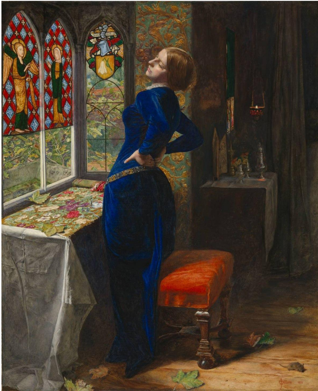
Mariana John Everett Millais 1851