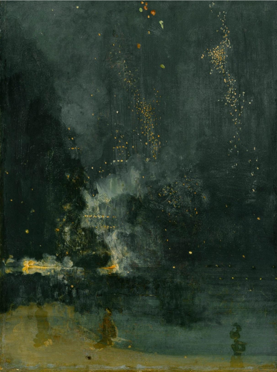
Джеймс Уистлер. Ноктюрн в черном и ЗОЛОТОМ