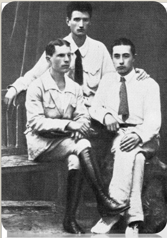
И. Курчатов (в центре) студент физико-математического факультета Таврического университета.