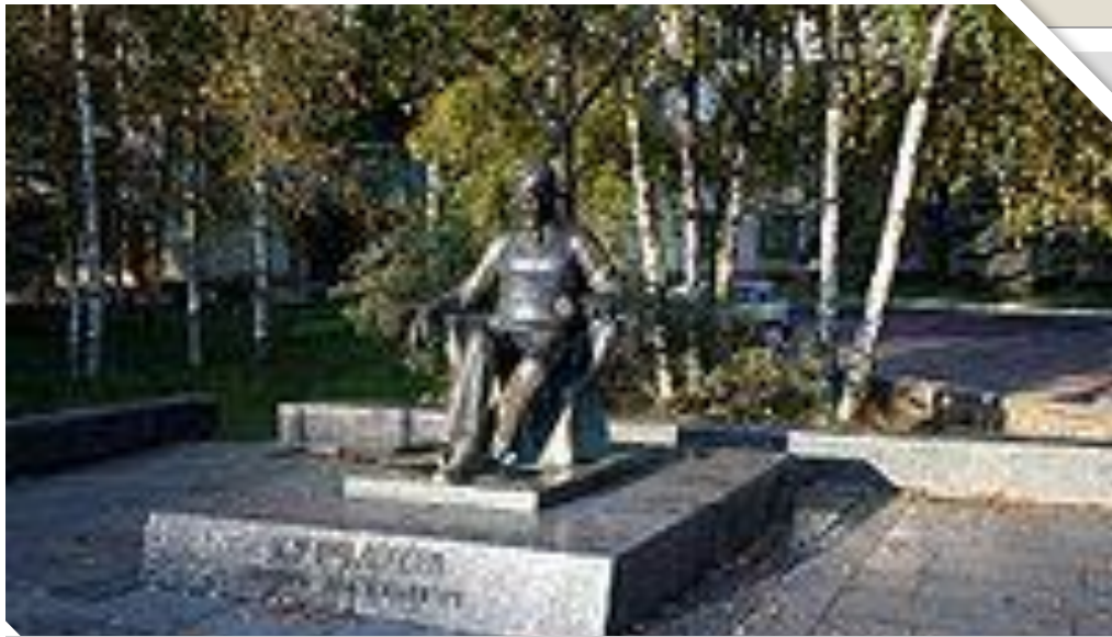
На улице Курчатова в г.Обнинске