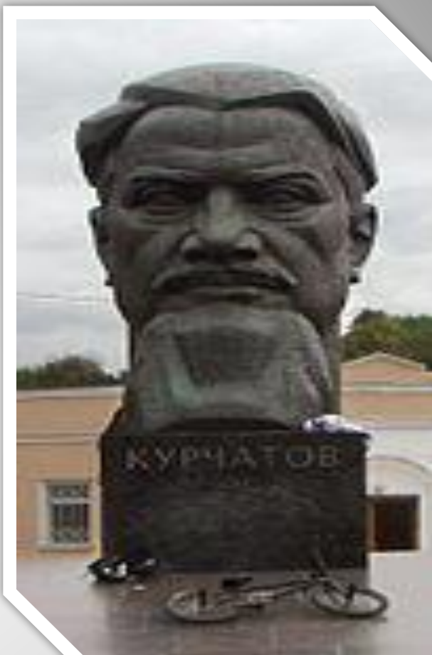
Памятник Игорю Курчатову на площади его имени в Москве.