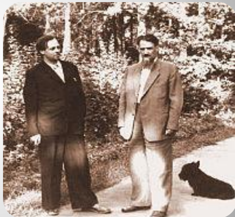
А. Сахаров и И.В. Курчатов (справа) (фотография 1958 года)