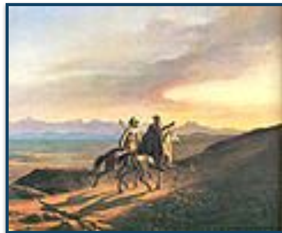
Воспоминание о Кавказе. Март — апрель 1838 г.