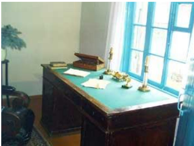
Стол и кресло Лермонтова