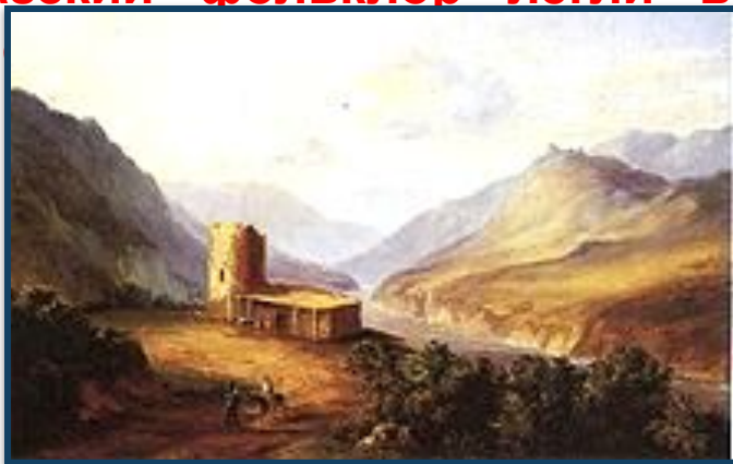
Кавказский вид с саклей. Картина М.Ю. Лермонтова. 1837 г.

Лермонтов успел сильно измениться в нравственном отношении. Впечатления от природы Кавказа, жизни горцев, кавказский фольклор легли в основу многих произведений Лерм