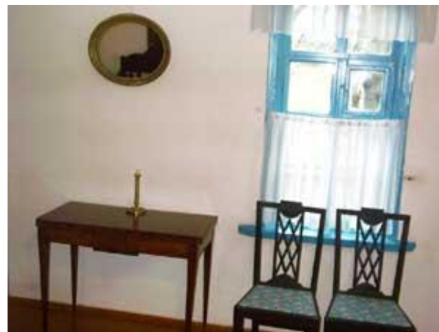
Лермонтовская половина дома