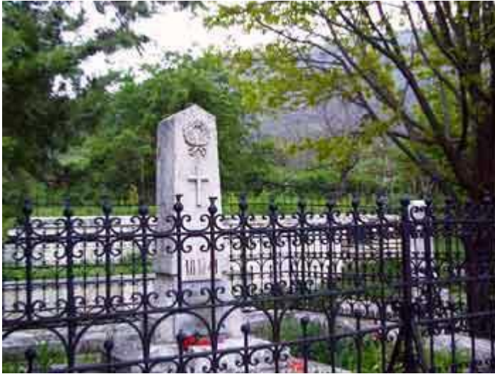
Место первоначального погребения М. Ю. Лермонтова