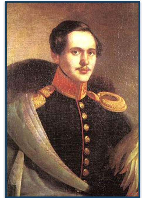
Лермонтов в ментике лейб-гвардии Гусарского Полка. 1837 г.

Не желая начинать все сначала, по совету родственников он поступил в школу гвардейских подпрапорщиков и кавалерийских юнкеров, где провёл, по его словам, "два страшных года". В школе господствовала военная муштра, запрещалось чтение художественной литературы. Но и в этих условиях Лермонтов урывками и тайком продолжал свои литературные занятия, работал над романом "Вадим" из эпохи пугачёвского восстания. Окончив школу, Лермонтов получил офицерский чин и был определён в лейб-гвардии гусарский полк, стоявший в Царском Селе.