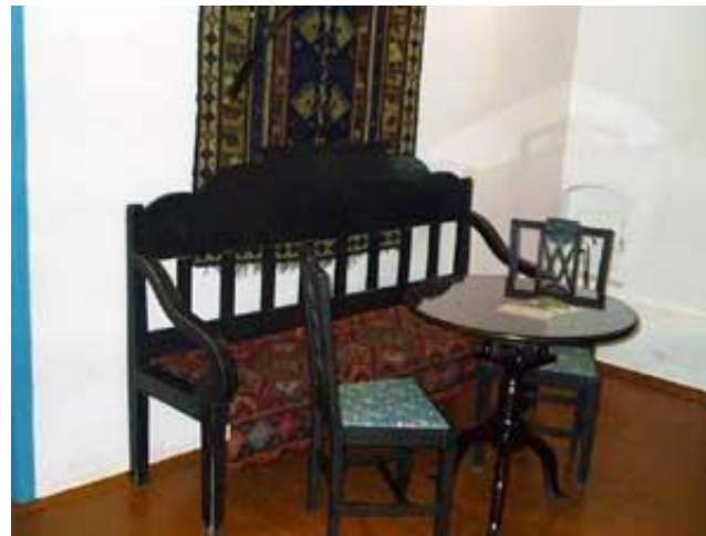
Стол, за которым работал Лермонтов