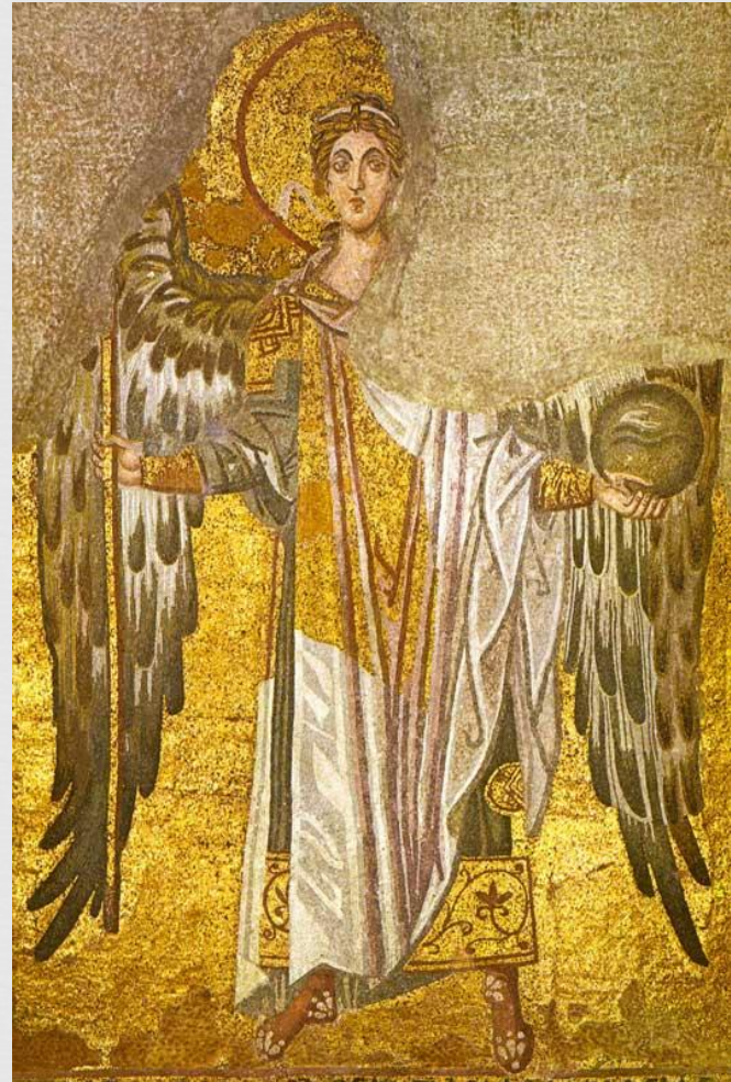
Архангел Гавриил (мозаика свода вимы)

Мозаика — от этого слова веет роскошью римских терм и величием византийских храмов. Само понятие мозаики необратимо включено в нашу жизнь. По сути, это одна из функций анализа нашего сознания, осязающего окружающую реальность и создающего из разных фрагментов жизни единую картину мира.