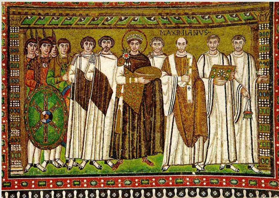
Император Юстиниан со свитой