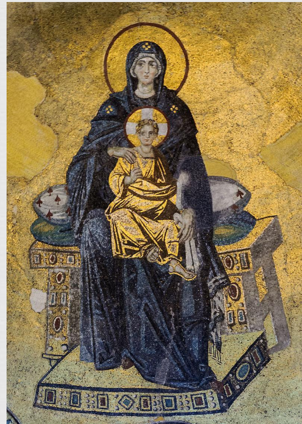
Мозаичное изображение Богородицы в апсиде