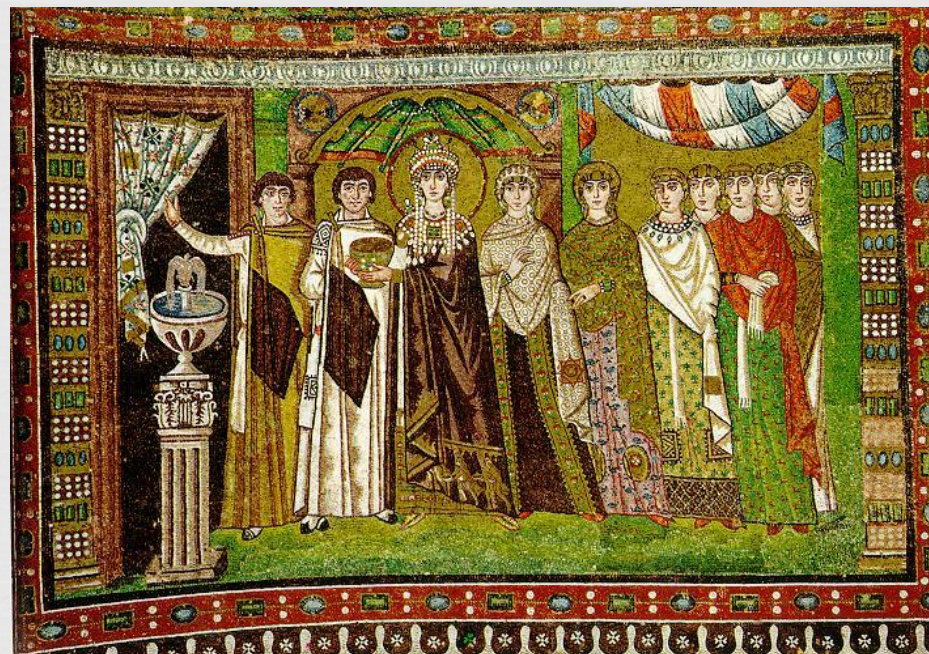
Императрица Феодора со свитой