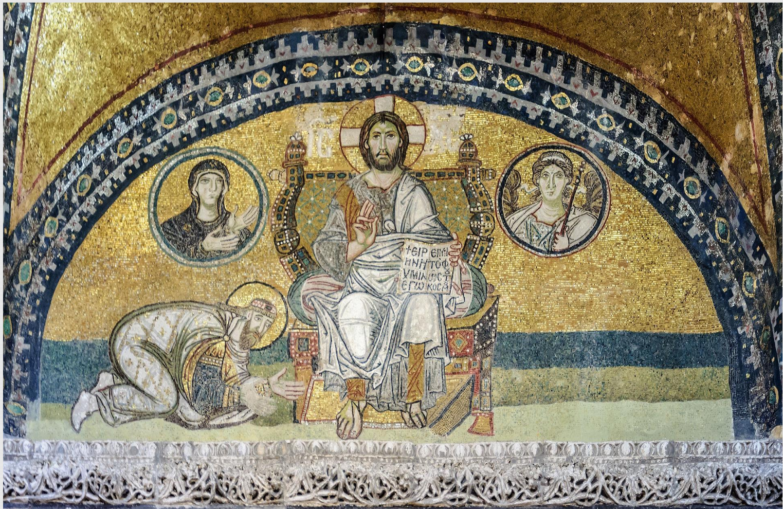
Император Лев VI преклоняет колени перед Иисусом Христом