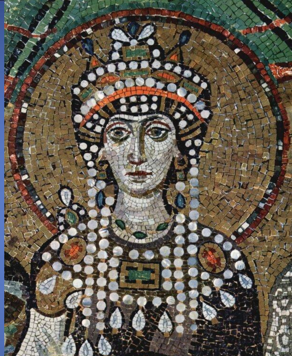
Царица Греческая Феодора VI

Мозаичное искусство - зародилось еще в Древней Греции и представляло собой складывание в единую композицию кусочков разноцветного камня, стекла и других материалов.