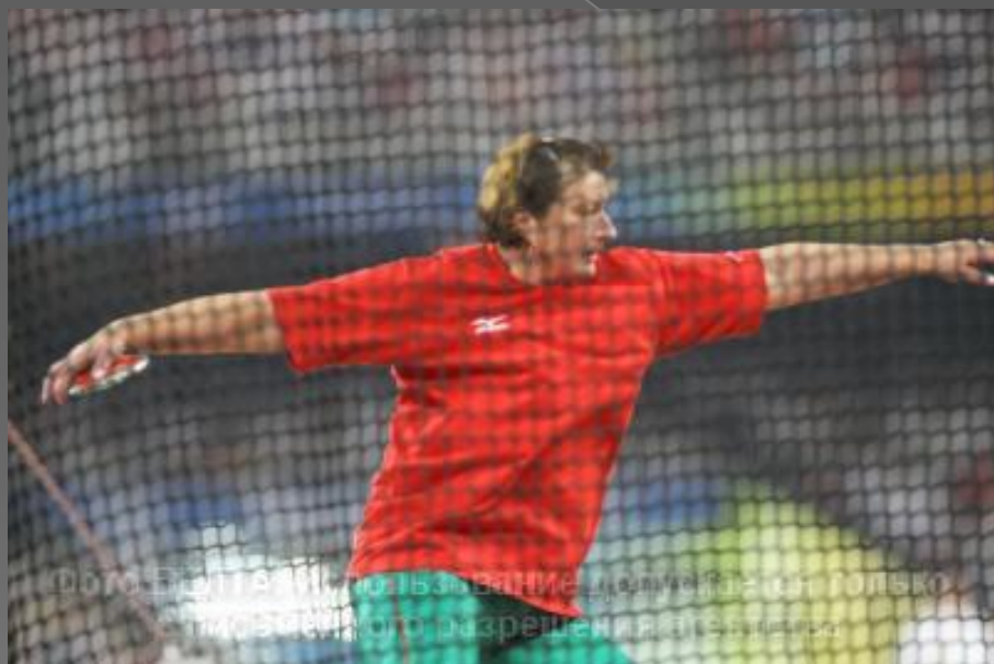
Фото: Е. Д. Г. А. 111. Использование для учебных целей только при условии от разрешения правообладателя.

Метание диска производится из ограждённого сеткой сектора с разрешённым горизонтальным углом вылета 35°. Запрещается выход спортсмена за границу сектора пока диск не приземлится. При броске диск может задеть ограждение сектора если другие правила не нарушены.